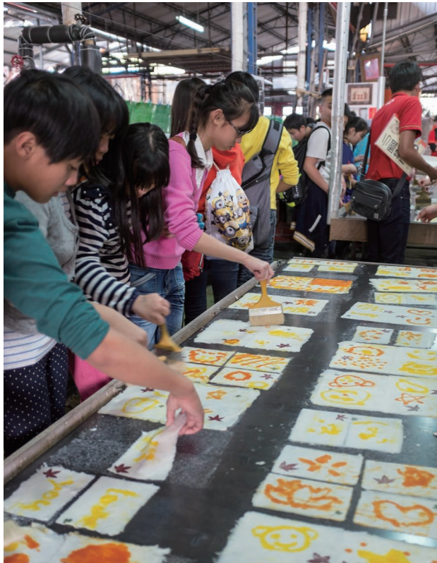
觀光教育推廣DIY抄紙體驗