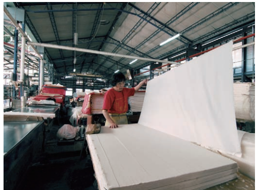
手工造紙流程—烘紙