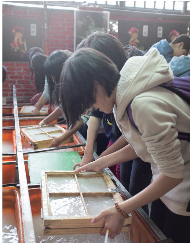
觀光教育推廣DIY抄紙體驗

格、品質與客製需求都能達到穩定永續的標準。這也促成廣興在修復和保存用紙的持續研發，不僅國內公私立文物修復單位，如中央研究院、國家檔案局、臺灣歷史博物館等前來尋求合作與協助，更不乏遠道而來的國外專業修復工作者。憑藉著多年來配合開發的造紙技術和豐富經驗，以及不斷嘗試新媒材的彈性與創造思維，廣興不只讓沒有想過的原料化成可用可食的紙張，也讓過往傳統書畫中難以克服的紙張缺陷獲得改善，更能夠配合不同專業需求的客戶開發新的手工紙產品，生產適合的紙給最需要的人使用。