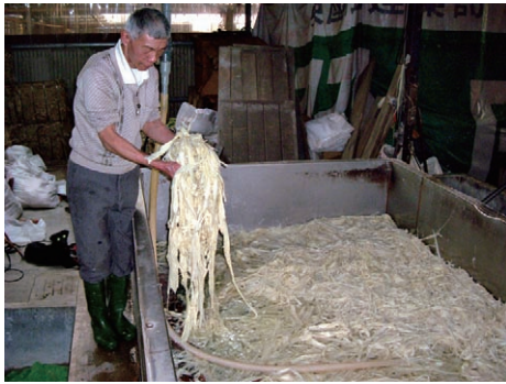
手工造紙流程—漂洗