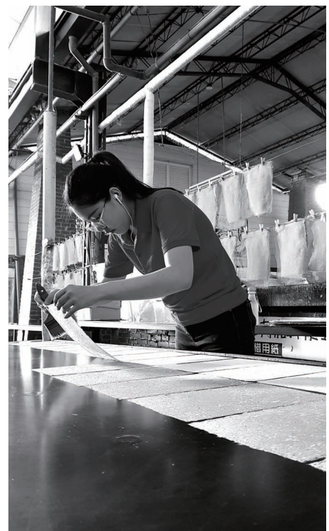
客製化訂單烘紙過程

針對此困境，黃煥彰觀察到近年來中國市場的崛起，雖然造成許多產業轉移和削價競爭的壓力，但新的需求也隨之出現。由於中國藝術創作市場的蓬勃發展，除了引發更高品質的紙張要求外，收藏修復與紙張保存的專業需求上也驟然增加。這些年來，廣興為了因應小規模生產的生存模式，不僅致力紙張新品開發，更廣邀藝文與相關專業人士前來試用與指教，並為建立生產履歷，以期規