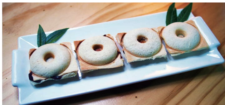
可食用的巧克力紙片