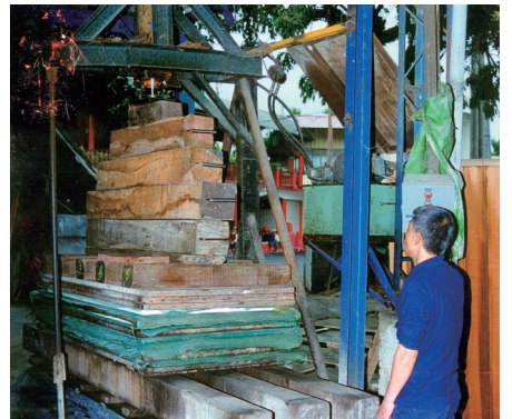
手工造紙流程—壓紙