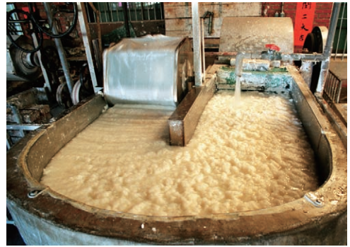
手工造紙流程—打漿