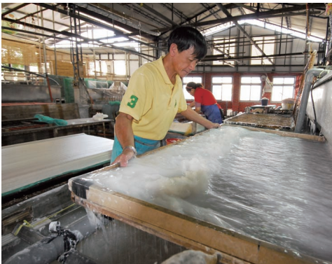
手工造紙流程—抄紙