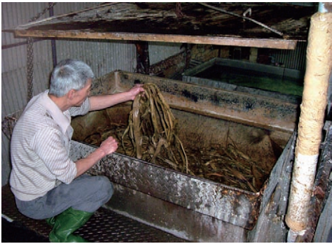
手工造紙流程—蒸煮