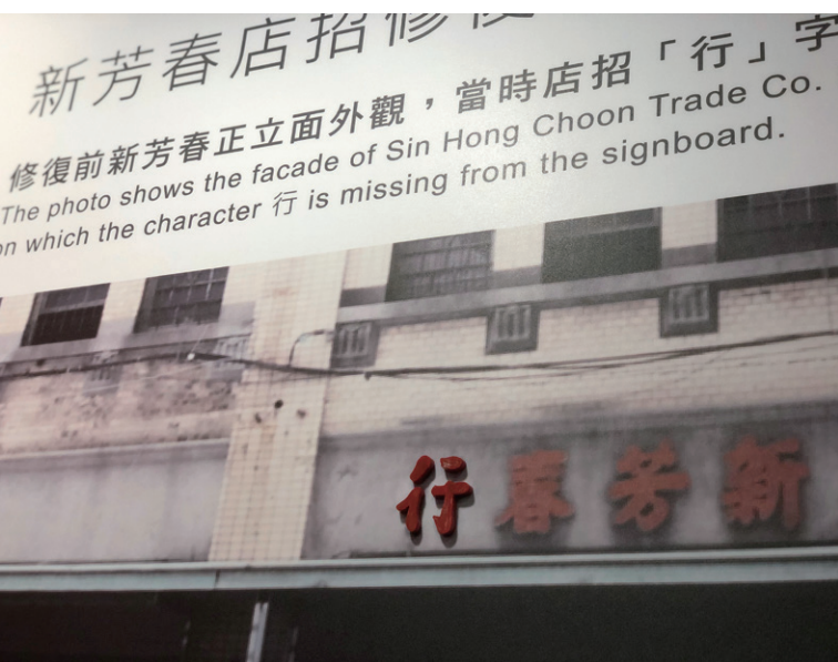
修復前新芳春正立面外觀，當時店招「行」字 The photo shows the facade of Sin Hong Choon Trade Co. in which the character 行 is missing from the signboard.

二樓的側面，天井旁的房間，則為「建築修復展」展區，展示了新芳春茶行修復的過程，未來預計將以不同主題檔期，陸續展出修復亮點。新芳春茶行在停業之前，曾改建、出租，所幸當年屋主在一次次改建中，留下了許多元件，例如建築面磚、馬賽克磚、天井洗石子柱等。為日後重新修復提供了充足的線索。展示舊建材文物及修復過程照片紀錄，詳加考究了原建材，盡力予以重現。修復展除了展示詳盡的成果紀錄及照片之外，每個部分負責修復的匠師姓名也都一一羅列，既完整且精細體現茶行建築之美，同時也是對修復此一專業，表達最高的敬意。