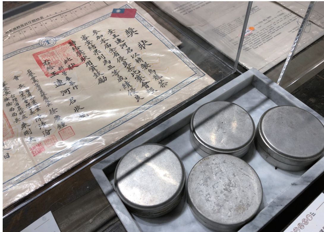
1 王連河參加全臺省優良茶比賽的得獎獎狀 2 建築修復展在展示上亦有巧思，新芳春行之「行」字浮貼，表現「行」字經修復後還原的情形。

此外，為呼應茶行建築物的古舊氣氛，別境書店也引進與文化、歷史、古蹟相關的書籍，以及採用復古元素如窗花、老玻璃等來創作日常小物的文創品牌，以現代的觀點重新演繹。從選物和展示方式，可以看見選物師致力讓當年茶行及大稻埕周圍的風華，融古於今，展現茶文化更為多元、立體及生活化的一面。