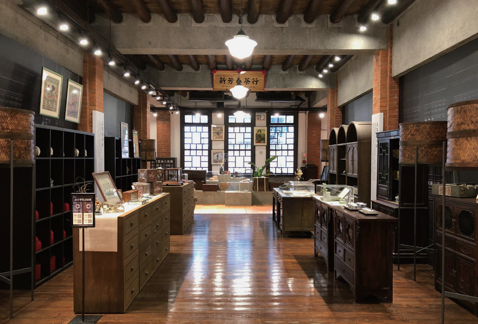
新芳春茶行二樓現況，地板的鋪法變化，區分出建築前中後三進。