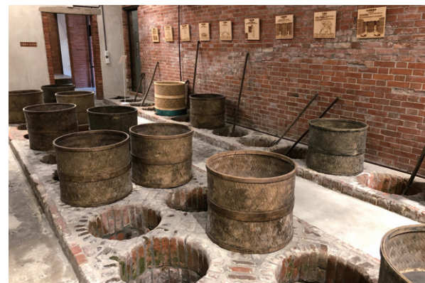
一樓後進的「焙籠間」是過去採茶工人焙茶所在，保存良好，難得一見。

二十世紀上半，大稻埕是臺灣茶葉與樟腦外銷貿易的重要據點，因此與外來文明大量接觸，最時髦精彩的生活和文化活動都在此發生。位於民生西路上的「新芳春茶行」，即是這段繁榮歷史的見證者。新芳春茶行建於1934年，是來自福建安溪的大稻埕茶商王連河所自建，曾是臺北最大的茶工廠，當年以包種茶為主銷商品，外銷東南亞安南、暹羅、井裡汶等地。