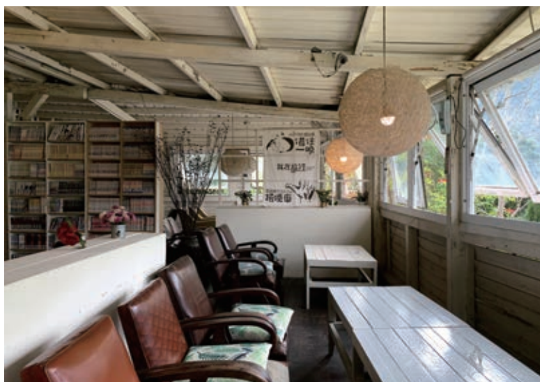
舊事生活是由內灣老車站宿舍改造而成，放眼眺望可以看見行駛中的內灣小火車。

如今的他，深刻體會到故鄉的土這麼黏，他在這裡帶動一群老、中、青年一同實踐夢想，將他黏在這裡，孕育自己的下一代，愛上內灣，以生為內灣人為榮。🌱