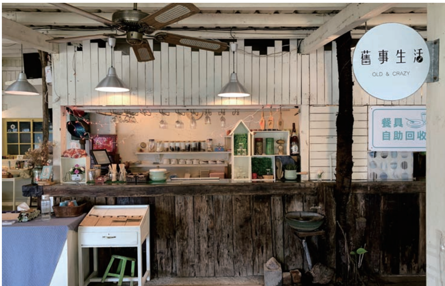
舊事生活，提供客家與異國烹飪的特色料理。