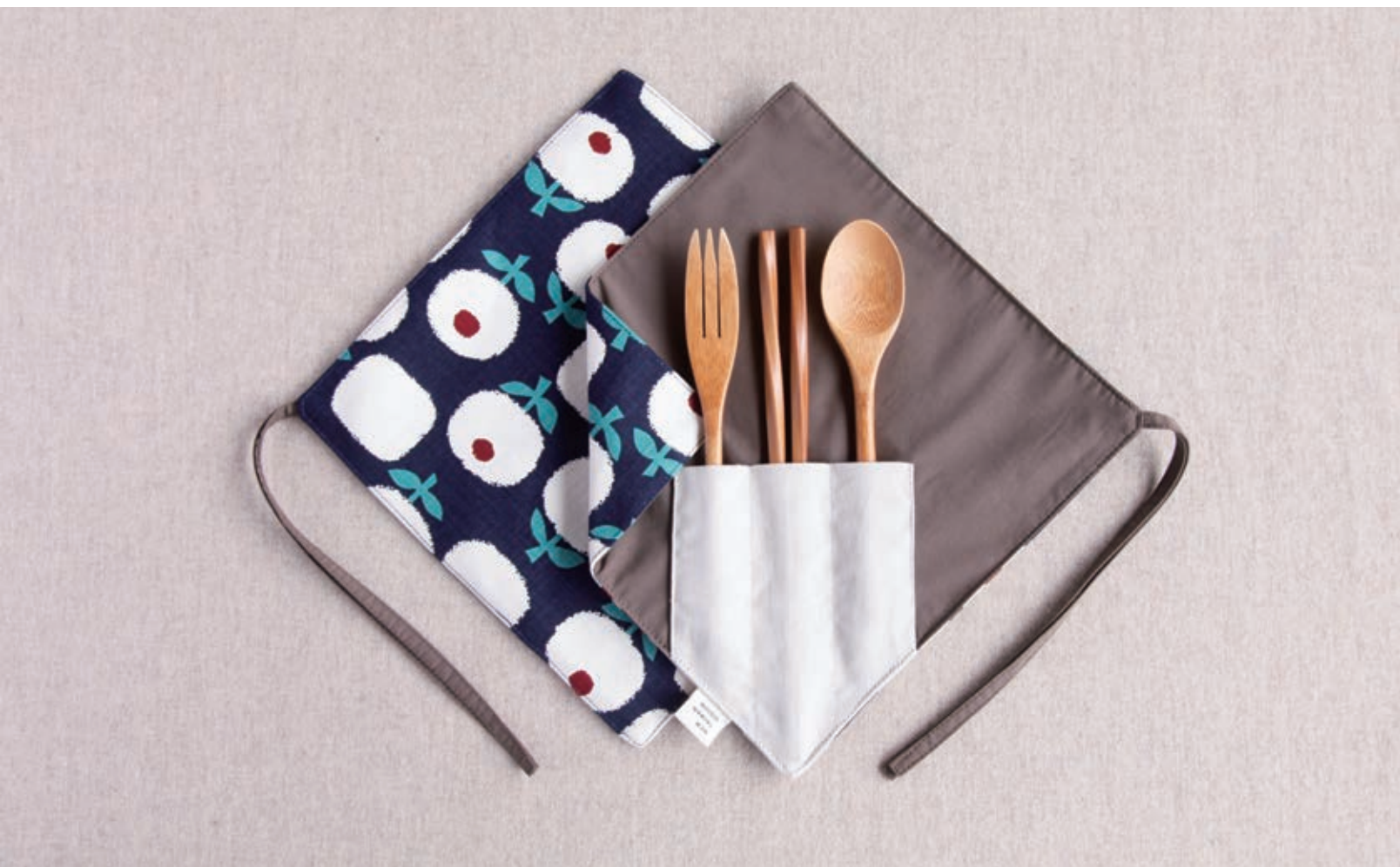
「一角餐具組」設計意象反映現在家庭團圓時常獨缺的就是一角，少一雙吃飯的筷匙，讓遊子不忘親情的呼喚。