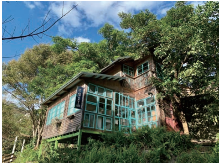
用老房子拆下來的廢材，打造宛如童話風的工作室，讓四面都可以透光且空氣流動。

到那辛苦敲打銀片予人幸福的年代。近幾年，更有婚紗業者，陸續商談異業合作，在此地拍攝婚紗、製作定情戒，也帶動內灣成為一個愛情小鎮。