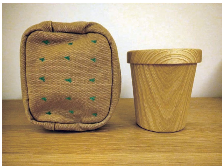
使用蘑菇的小包包，將外出用的木質杯具收納起來，方便攜帶。

How to Choose? Ask People with Great Taste