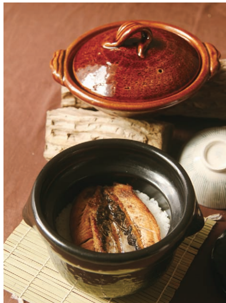
日本雲井窯的黑樂飯鍋

日本柳宗理的不鏽鋼系列也是她在一次的邂逅後愛不釋手的廚具器物，這些均體現了柳宗理思考用即美的概念，將日本民藝的精神與溫度融合在冷峻的現代工業設計理念中，是日本戰後現代工業設計歷程中極具影響力的代表。柳宗理在設計器物的過程中不畫草圖，而是透過手來思考，透過石膏、木頭與手直接感受去製作，全部在手中成型，完全貼合體感的使用且相當舒服。看似簡極的單手不鏽鋼鍋的鍋緣兩邊，均有開口能夠讓烹煮時左右均可透氣，且可以隨著鍋蓋的移動改變蒸氣散出的程度，完全在思考用之美的部分，其他廚具系列也都有驗證了用的觀點。