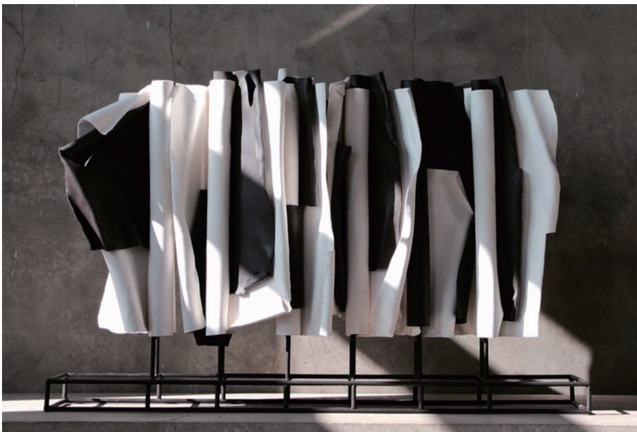
吳偉丞陶藝作品