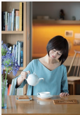
引領餐旅品味的葉怡蘭，總能細膩地分享好物的使用哲學與精神。