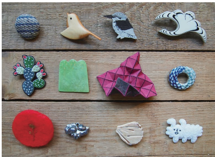
異國各地小巧的別針，呈現著陳育平對文化與材質的敏感度。

另外一系列與材質相關的器物則為小巧的別針，呈現了她對異國文化與小巧之美的敏感度，從她在美國北