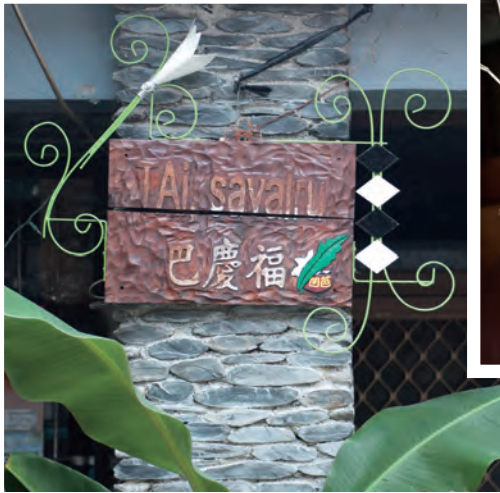
很有原味的陶板門牌