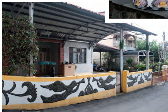
牧師的家門矮牆裝飾