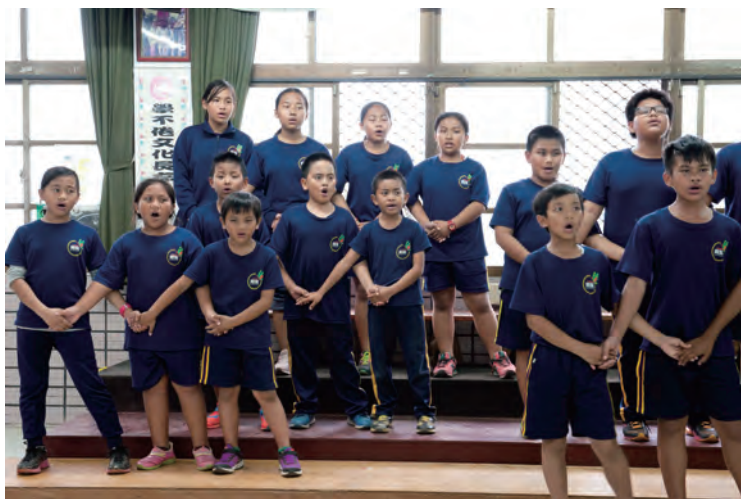
以母語為主的合唱團練