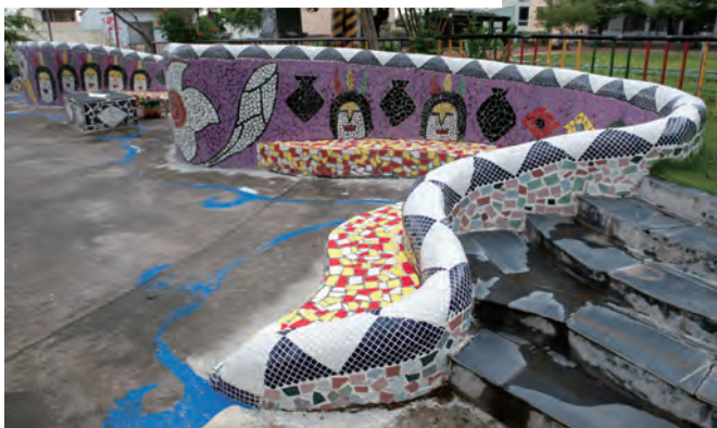
訴說巴冷公主與百步蛇相戀傳說故事的戶外座椅與壁畫