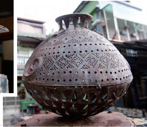
陶甕造型的鏤雕鐵塑作品