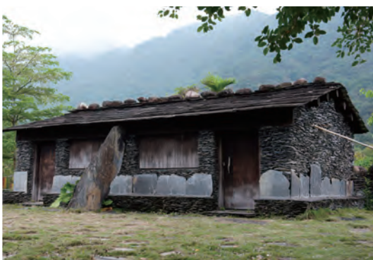
別具特色與意義的石板屋