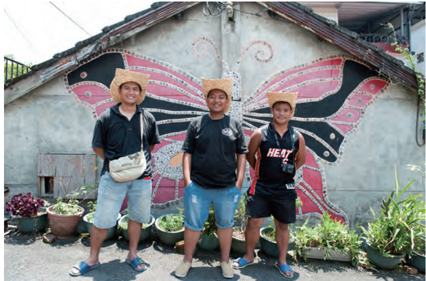
笑臉逐開的部落青年身後有蝴蝶圖騰的壁飾作品

貼、鑄鐵、金屬、木雕、石雕等。在魯凱的傳說裡，祖先於溪流中看見小石子在陽光的反射下，閃閃發亮，非常美麗！有如祖靈流下晶瑩的淚光，也是對族人悲憫的守護，教族人感動！於是，在社區中，常見藝術家利用自河邊撿拾，經由大地的琢磨刷洗、沉穩而明亮的小扁石，作為圖騰的底圖或輪廓，在施工上，相當費工，卻是最自然的作畫元素。另外，標購回收的昔日木電線桿，加以設計，橫放作為公共座椅，都是深具巧思，且原汁原味的原民創作。