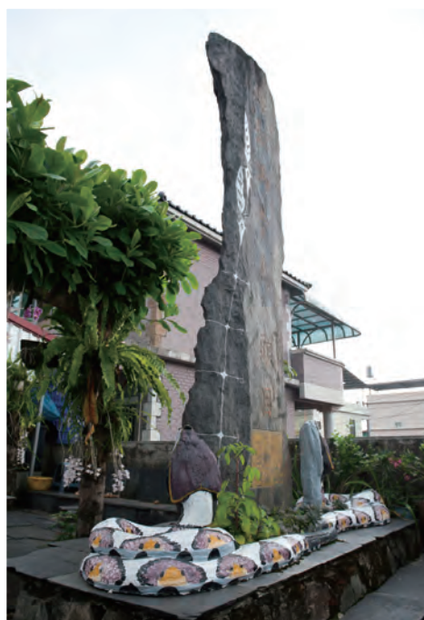
頭目後代的門前造景

相較於其他地區原民部落的社區彩繪，會發現，青葉社區裡街道和家屋外牆的彩繪顯得立體而生動，原因在於其創作的素材或形式，並不限於平面彩繪，還包括石子拼貼、彩磁拼