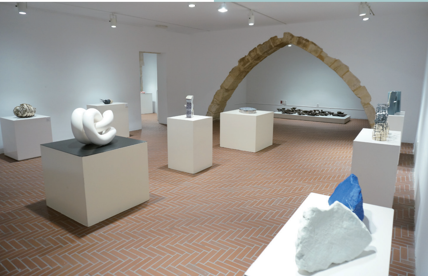
1 展場一隅 2 頒獎晚宴進行

個城鎮並不大，也因此上班時間更為精簡，工作六小時，中間三個小時的休息時間，到下午五點，街上才陸續有居民上街活動，當地人對亞洲人非常陌生，走在路上不斷被注視。可能筆者在臺灣的工作時間也短而零散，來到這裡有著一種莫名的歸屬與舒適感，原來筆者一直過著西班牙生活。