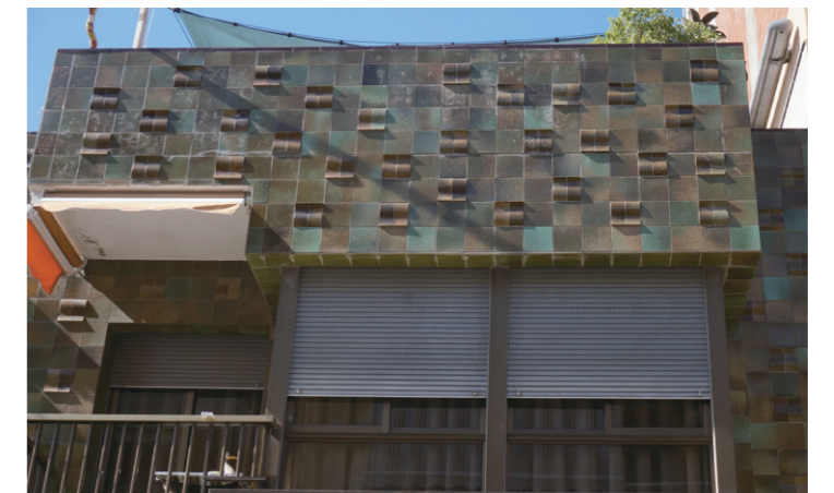
1 El Vendrell下午人們逐漸外出 2 筆者於展場外留影 3 當地陶瓷外磚

西班牙行的安排讓人焦頭爛額，包裝、貨運問題甚多，又與當地有七小時的時差，來回溝通效率不佳，雖覺得著急，卻也順著對方的緩慢節奏逐一化解，想像自己在西班牙人眼裡是什麼樣子，應該是一個極急躁的亞洲人吧！如今再想起還是好笑。筆者將頒獎日期排在旅程中間，一方面了解當地民情、融入生活，一方面緩衝可能發生的耽誤，於是先後停留了馬德里、瓦倫西亞以及巴塞隆納，西班牙的歷史、複雜的種族所遺留下來的建築、文物都能在都市裡窺見一二。途中走訪了高第（Antoni Gaudí i Cornet）、達利（Salvador Dalí）等跨時代創作，參觀只在書上看過的藝術作品，或浸淫在跳蚤市集琳瑯滿目的物件裡，窺探許多時代的火花，那些材質的演變、造形符號的使用、技法呈現的面向，讓人對當地人們的生活想像無限蔓延。