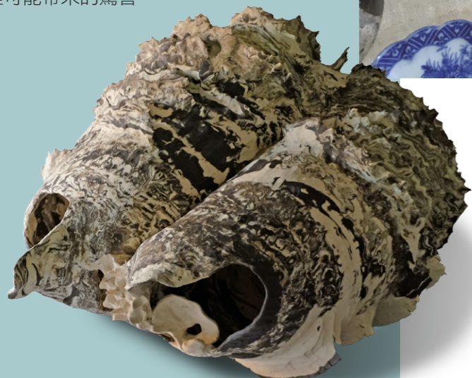
1 巴塞隆納城內市集 2 楊育睿的入圍作品〈The Shell Of Island〉