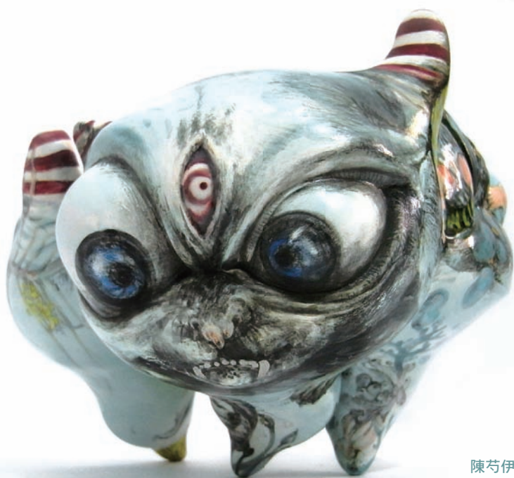
陳苡伊 表層潛浮 2013 陶瓷 18×22×23cm