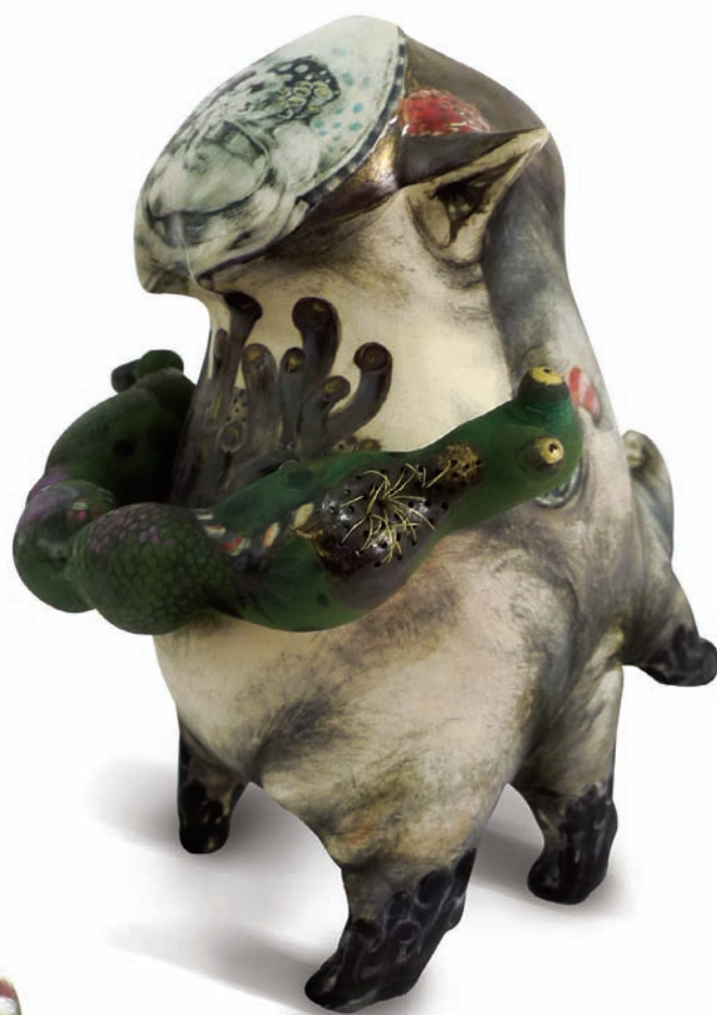
陳苡伊 草露間。水族散步 2013 陶瓷 18×24×24cm

或許可歸功於學動畫的經驗，陳苡伊的作品特別有一種活潑的動感與鮮明的意象，讓她獲得今年慕尼黑國際工藝大展Talente入選的〈表層潛浮〉和〈草露間。水族散步〉顯得別具個性。〈表層潛浮〉中睜著兩隻骨碌碌的大眼、呲牙裂嘴貌似憤怒的生物，既有動物的五官特性、動畫的誇張輪廓，也在陶瓷的古意染繪中帶有幾絲傳說祥獸的神氣，作品於是成了視覺記憶的想像載體，借獸的外觀並呈陶藝家的童真幻想與文化遙想。「獸」做為想像的野性比喻，在〈草露間。水族散步〉中頂著奇形異圖的四腳獸身上更是顯著，水生動物意象讓獸跨越了陸生性質，成為衝破軟與硬、土與水界線的顛覆者。有頭無身也好，有身無頭也罷，獸在二作中皆是想像的化身。🌿