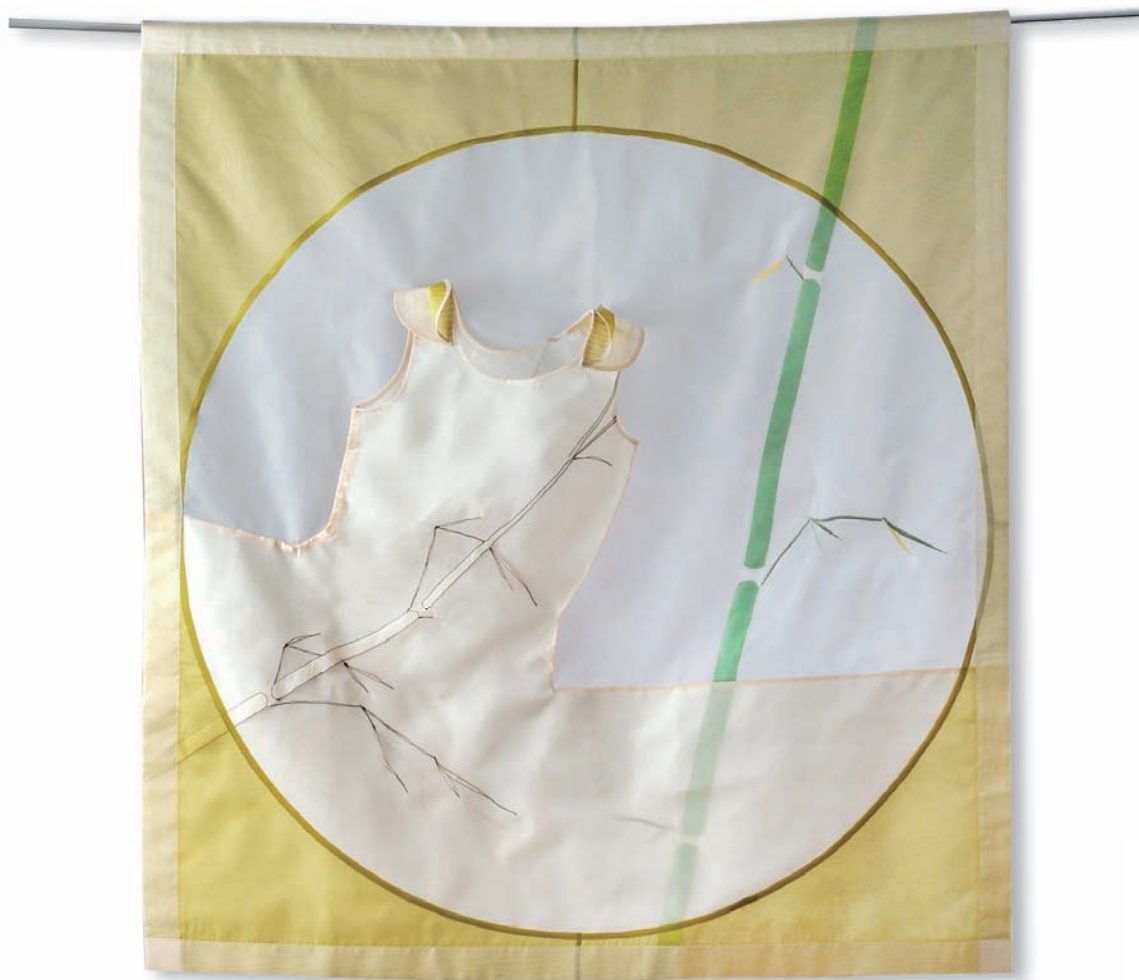
李玉蓮 Apparel Movement 2013 烏干紗（絲） 137×122.5cm

「人與藝」是國立臺灣工藝研究發展中心邀集臺灣工藝之家、良品美器—臺灣優良工藝品入選廠商，以及工藝新趣得獎者、國際工藝競賽得獎者、YII品牌廠商等加入分享創作成果的發表平臺，是為臺灣優良工藝師特別開闢的紙上發表園地。