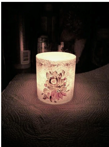
以酒瓶底部做成的燭杯