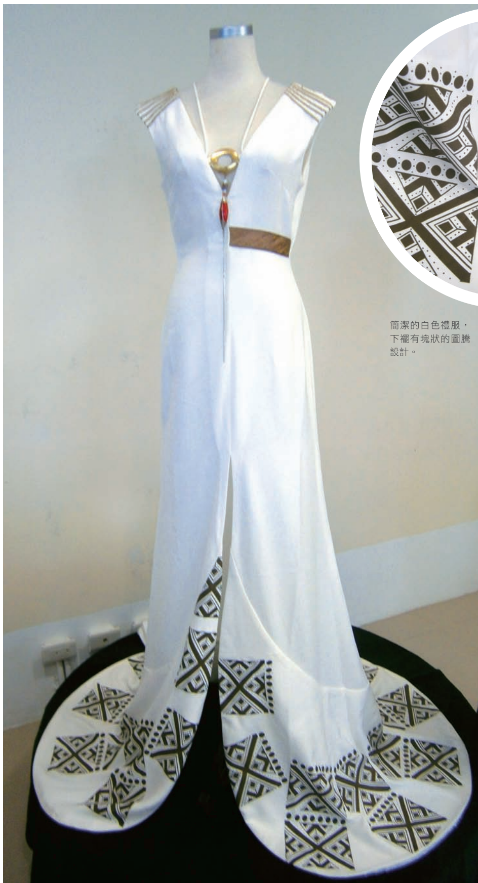
簡潔的白色禮服， 下襬有塊狀的圖騰 設計。

元素與都會時裝細節，在她的巧手中天衣無縫地交融為一體，迸發出令人讚嘆的時尚火花。隨後她也在公家單位安排下，赴加拿大、紐西蘭等國展出，親身與來自各國的時尚人士交流；她所設計的原住民服飾禮