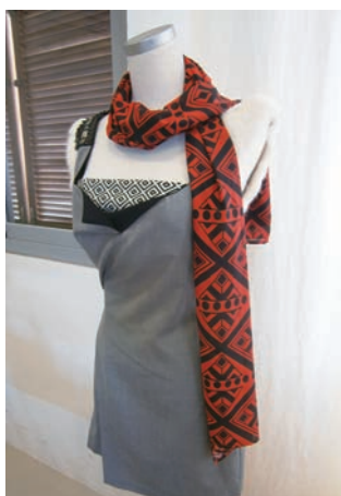
富有抽象現代感的絲巾與短裙