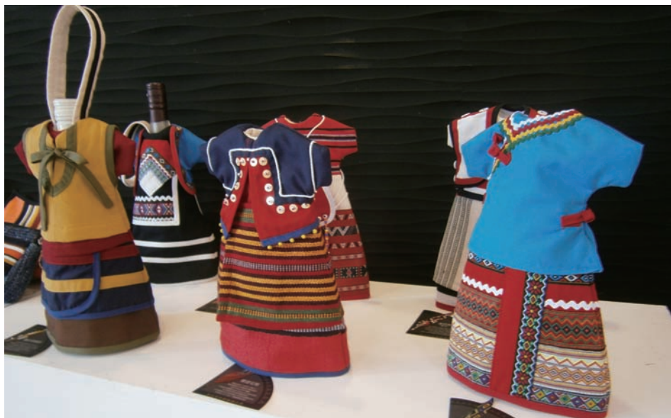
取材各原住民族傳統服飾的酒衣袋