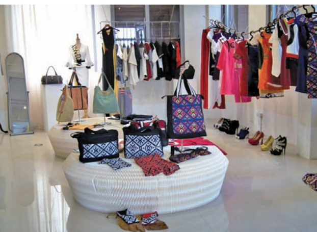
Siku原時尚文化藝術空間內部