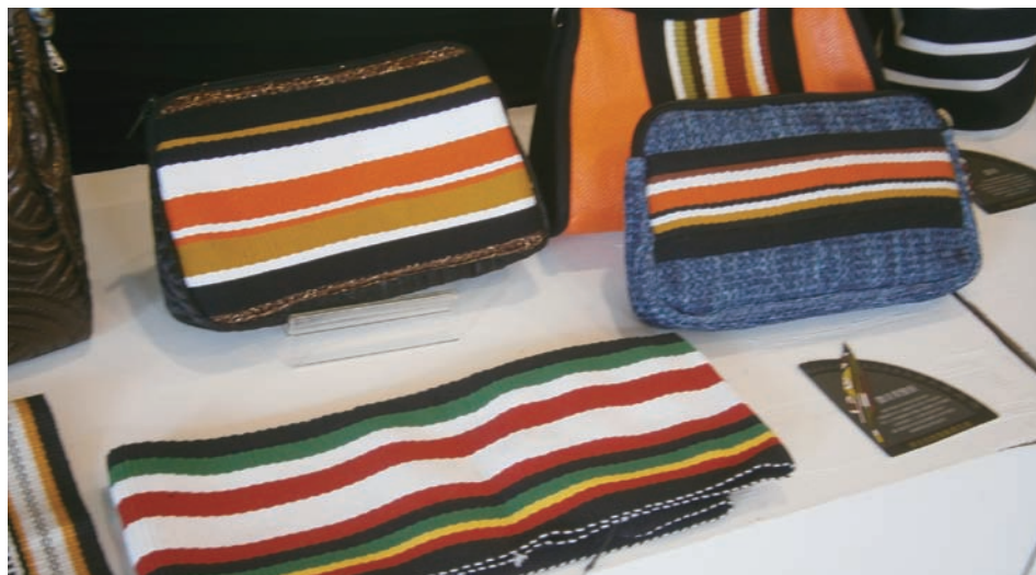
色彩濃烈的條紋包款