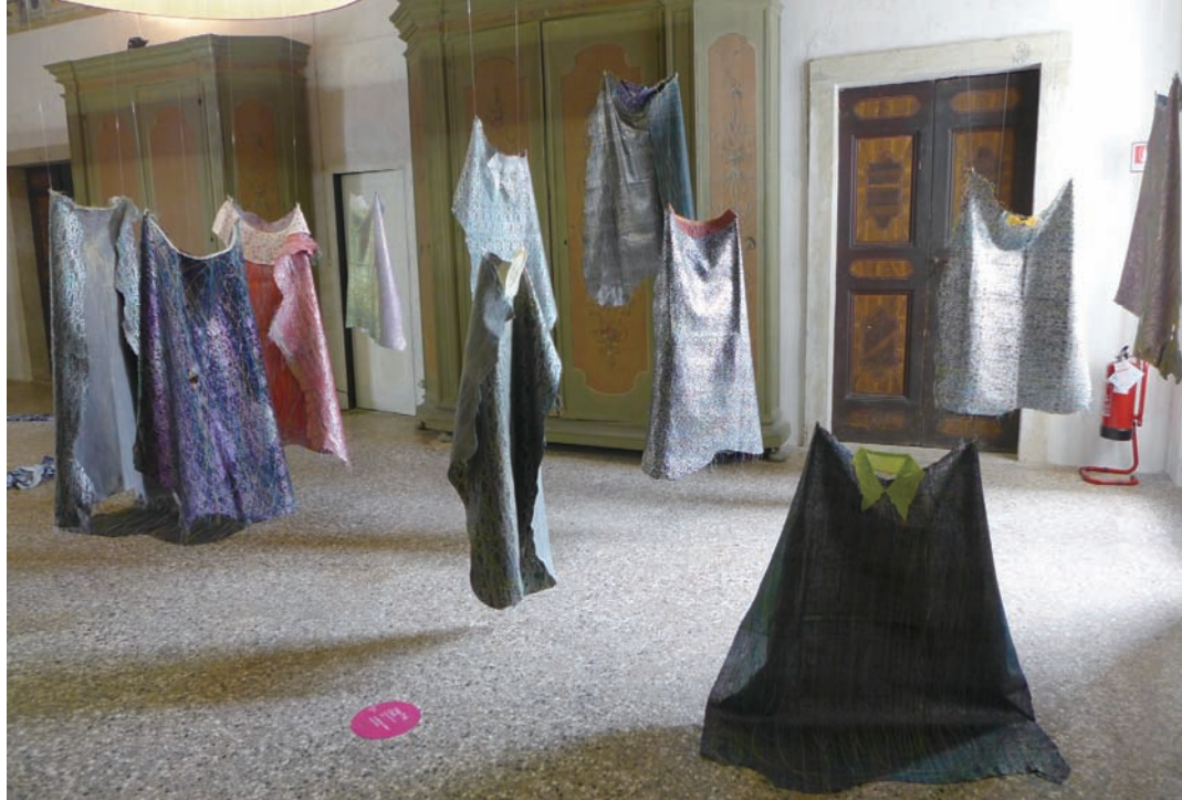
（左上）〈鐵鏽日記〉局部 2012 棉紗布料，稀釋白膠，鐵鏽染