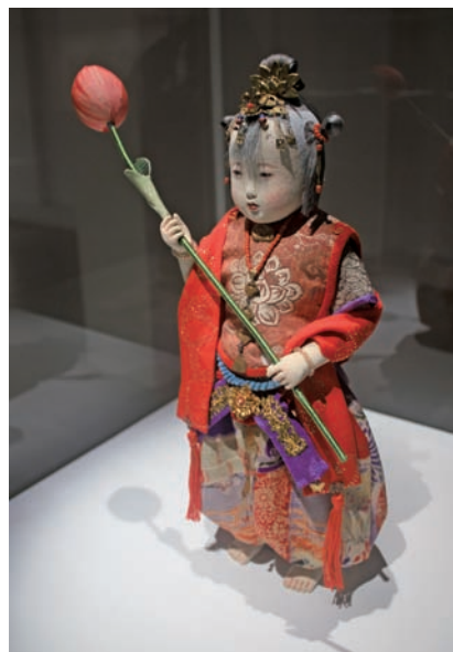
成田順子的人偶作品，細緻而巧麗。