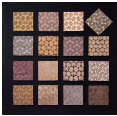
林潔怡 花語 2009 棉布、金蔥粉