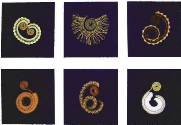
林潔怡 孕 2011 棉線、麻線、棉布