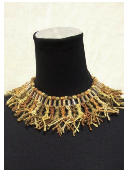
林潔怡 「結」系列 2011 鋼材、麻繩、塑料

林潔怡平時與家人都在社區大學、樹德科大職訓推廣織物和染色相關課程，她自己更是從研究所畢業後就開始教學，累積了多年經驗。林潔怡以教導天然染色技法為主，將一塊布料以縫紉法調整造型，再加以染色，就能在同一塊布上形成深淺不同的色澤變幻；染好後的布料，林潔怡則會指導學生進一步創作包包、服裝等生活用品。在勞工局