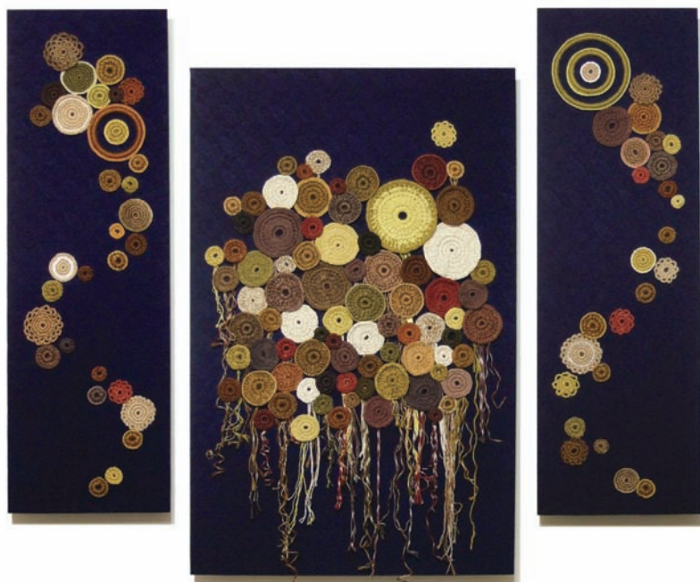
林潔怡 結緣（圓） 2012 線、麻線、棉布