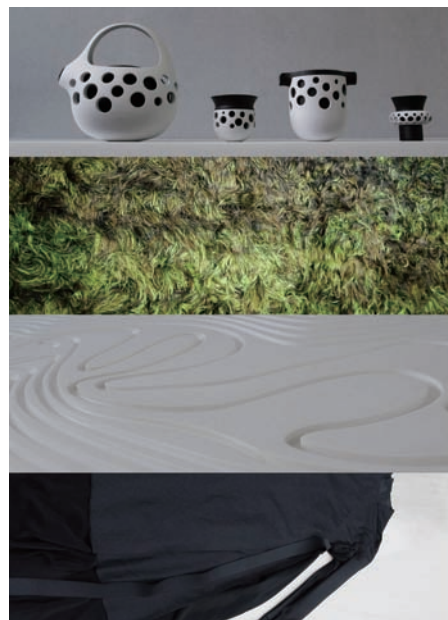
「tea party」中八位藝術家的成品