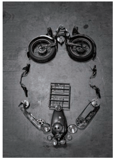
「洛可可計畫」中拆卸摩托車的過程

業工作者的創意，更顯現出了臺灣軟實力的強度，工藝家除了更能以開放的胸襟接受天馬行空的創意之外，設計師也增長了對各種媒材的接觸經驗，新的創意也從中孕生。何忠堂接著讚道，「工藝時尚」非常有心，每個年度都會邀請國際知名設計師一起加入，為這個跨界的