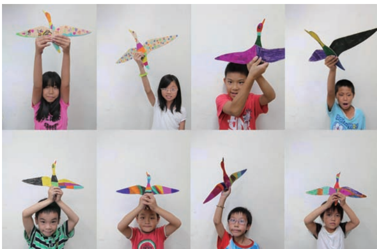
參與「候鳥計畫」的小朋友們

可說是臺灣中生代設計師選擇至新興歐陸學院留學的重要前輩。不久後，何忠堂也來到同間學校留學，兩人皆於入學的隔年獲邀至楚格設計（Droog Design）米蘭家具展參展，初生之犢的威力之猛，從這裡就可以看出。