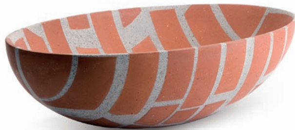
「砌磚計畫」的橢圓系列作品

創意高峰會所投入的人力及物力，令參加的人員皆十分敬佩。在當時的計畫方向執行下，一批批工藝結合設計的優異作品不斷誕生，活化了臺灣的創意產業；而在屢赴歐陸各大國際展覽積極曝光的規劃下，國際媒體也注意到了「工藝時尚」這個設計界的新面孔，這個品牌所展現出的臺灣設計力驚豔四方，每回參展總是讓外國媒體們引頸期盼。