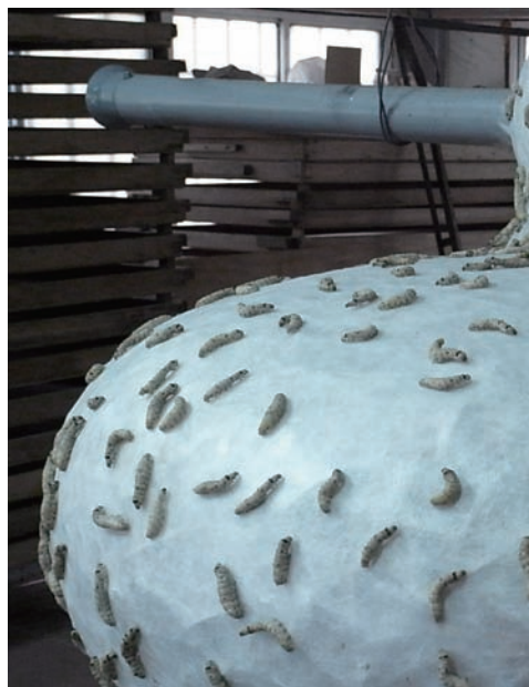
蠶兒們正忙著吐絲結繭的創作