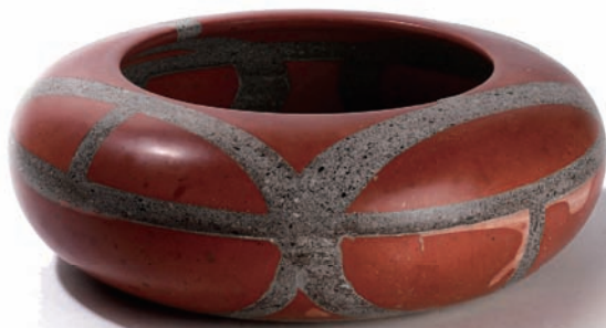
「砌磚計畫」透過現代設計容器喚起對老建築的記憶