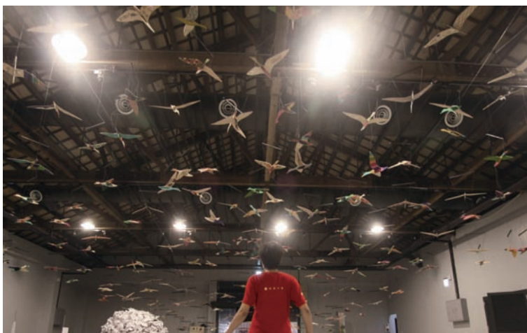
「候鳥計畫」於高雄駁二展出的情景