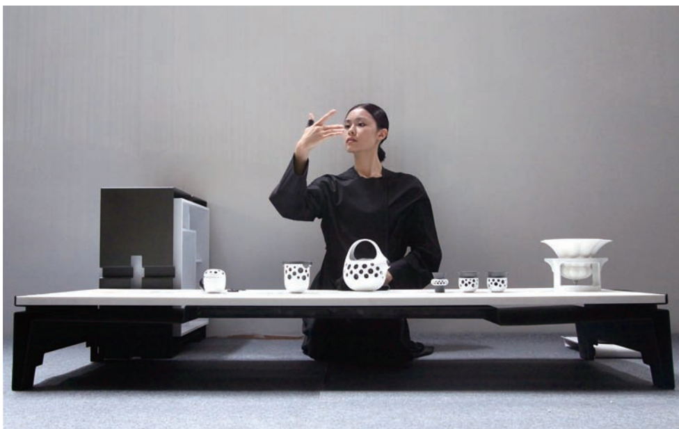
「tea party」的跨界概念，在舞者的曼妙舞姿中呈現。