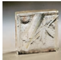
吳世興 竹香滿室伴人間 玻璃

之家」，因此更具傳承的使命感、國際觀，希望藉由教學與創作把藝術的種子散播出去。本次展覽特別以吹製、脫蠟、烤彎、熱塑、冷刻等不同技法的創作多樣作品，讓參觀者更能了解琉璃製作的各種趣味。🌱