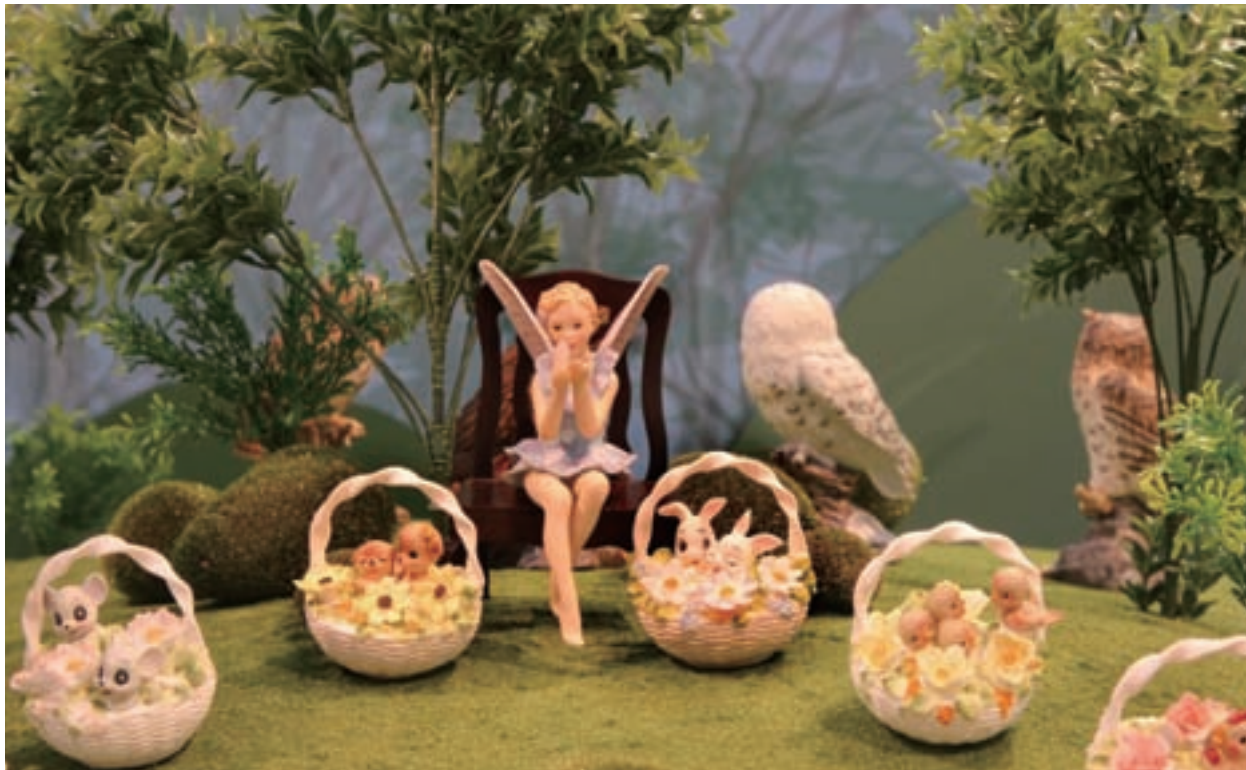
充滿童趣的陶瓷展品系列／下圖：陶瓷娃娃精緻的服飾也是展覽亮點