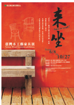
「來坐一臺灣木工藝家具展」海報

「椅子」自初民時代開始即和人類有著密不可分的關係，古人說「行、住、坐、臥」皆學問，但我們卻常忽略一張椅子其實就是生活文化的表徵。家具，它既為我們過去「生活美學」的一環，當我們今日在推廣「生活工藝與設計美學」之時，如能透過系統多樣的回顧與反思歷史的發展，將更能顯現文化廣大深蘊的當代價值與意義。