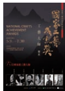
「國家工藝成就獎 工藝大師聯展」海報

本次聯展特邀六位國家級的工藝大師展出多元作品，期以頂級的作品展現臺灣工藝文化特色，共睹臺灣工藝之精湛。🌱