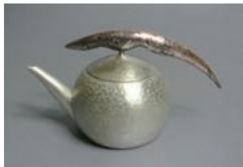
林國信 急須壺 金工

的藝術中潛心學習的心得，把傳統的技术用新思維、新造型詮釋，作品兼具實用與功能性，又帶著幾分生活樂趣。🌱