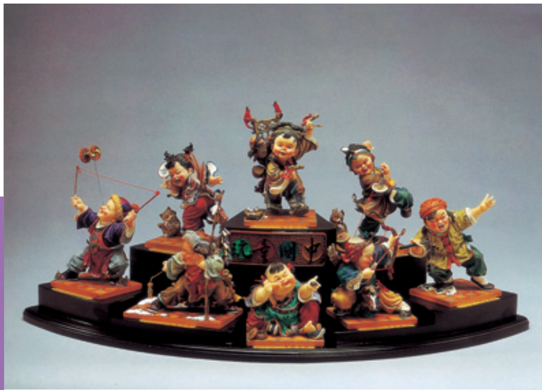
5/中國童玩珍藏系列/百匯通股份有限公司 義大利冷石、陶瓷粉/68×32×31

簡單樸實的遊戲，培育著中國孩童成長數千年，遊戲中的孩子流露天真、活潑的神采，純潔可愛的性質，多麼逗人喜愛。