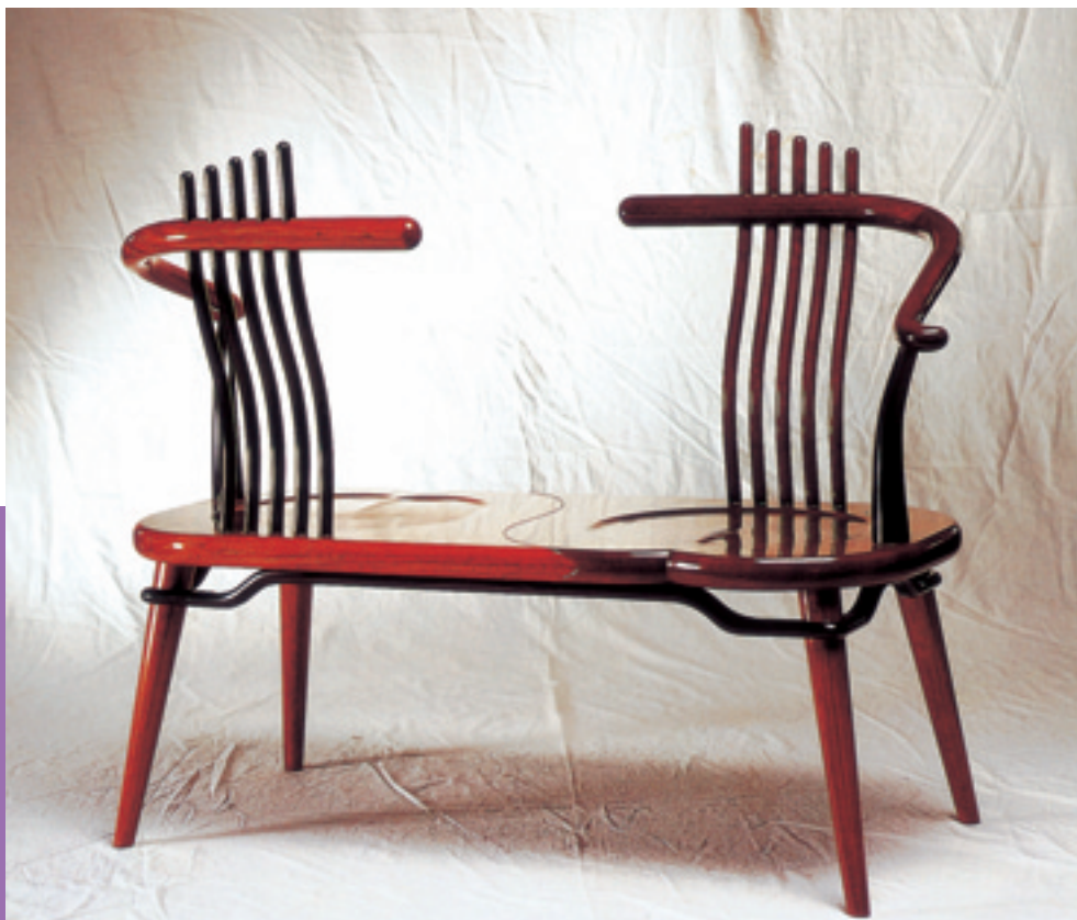
3/心儀／侯啓全 花梨木、黑檀木、瑪珈木／125×55×90