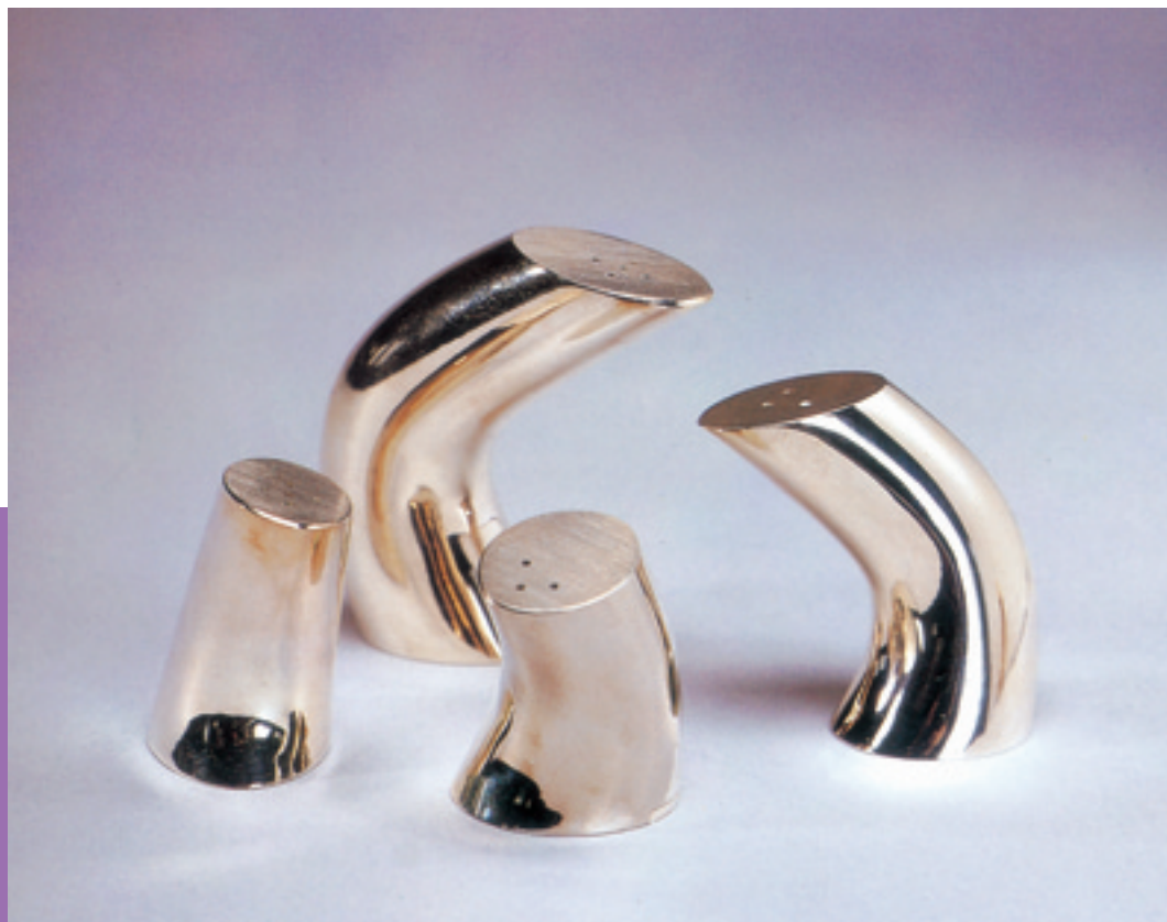
1/Happy together—調味罐系列—／趙丹綺

925銀／4×4×6／4×3.5×6.5／4×3.9×5.5／4×3.8×9.5