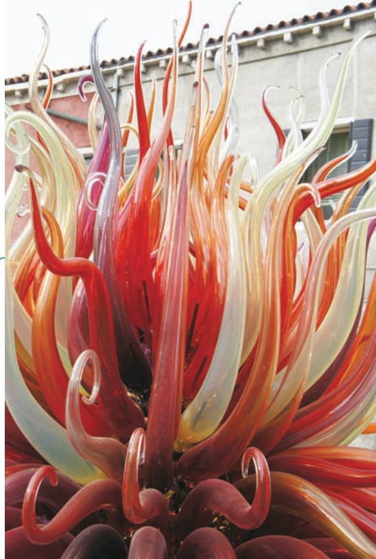
慕拉諾島獨特的火焰玻璃