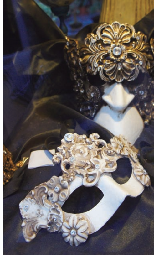
面具嘉年華已成為威尼斯全年無休的盛會