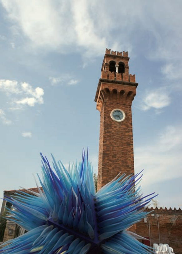
慕拉諾島已成為玻璃工藝的朝聖地