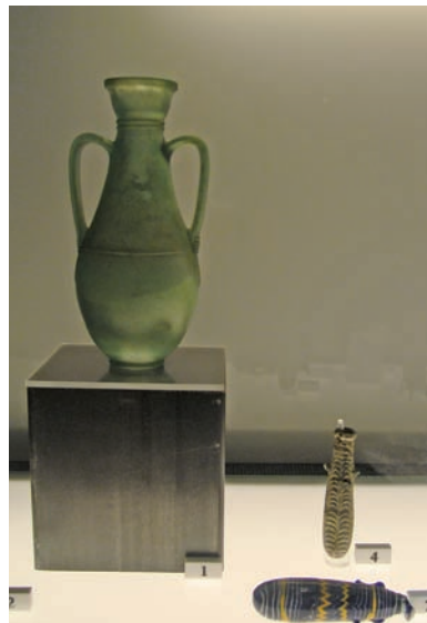
手工的不完美讓古玻璃更顯珍貴