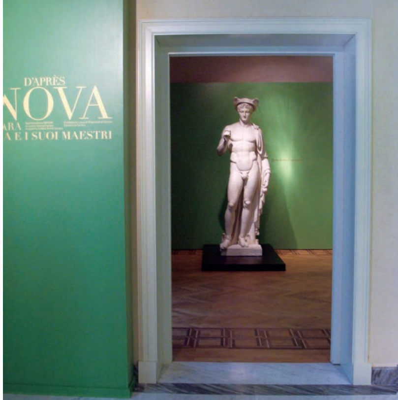
卡拉拉寶庫般的石膏博物館