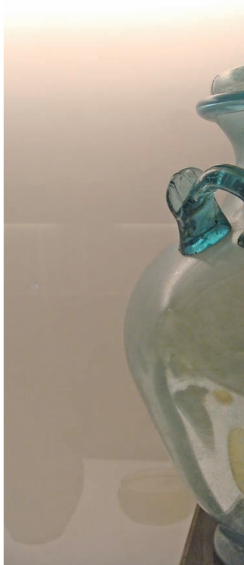
↑ 偏厚的古玻璃透著朦朧光線