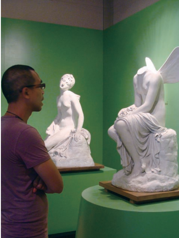
雕刻家觀察上個世紀的石膏雕像