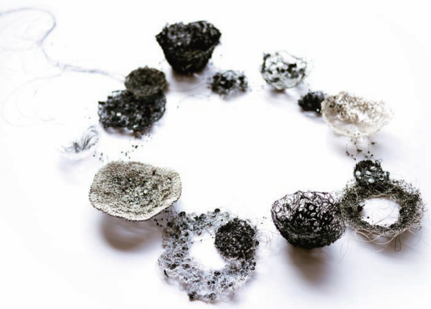
臺灣入圍作品1 紀宇芳 軌跡Trace 2011 棉線、魚線、亮片 60×40×20cm

不停止且深深著迷的活動之一，人們從事各種收集，從五花八門的零件、破舊的日常用具，到令人心醉神迷、深深渴望的藝術作品。人們往往將收集而來的物件作為一種消遣的對象，甚至將此作為生命中的重要企求，或許是因為人類始終無法超離這種慾望。