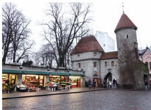
愛沙尼亞三年展位於塔林古城區中

對於身處炎熱氣候的亞洲而言，波羅地海三國之一的愛沙尼亞，始終予人一種遙遠又神祕的氣息，令人不禁反覆猜想著它的真實面貌，究竟較接近冷峻的天候還是濃烈的北國熱情。這個歷史上命運多舛的國家，18世紀到20世紀間反覆受到俄羅斯與德國交替占領，最終在1991年獨立，但即使曾被吞併良久，愛沙尼亞人卻絲毫不減對於自身民族意識的擁護，這種強烈的認同也反映在藝術創作之中，構造出相當穩健而篤實的風格。