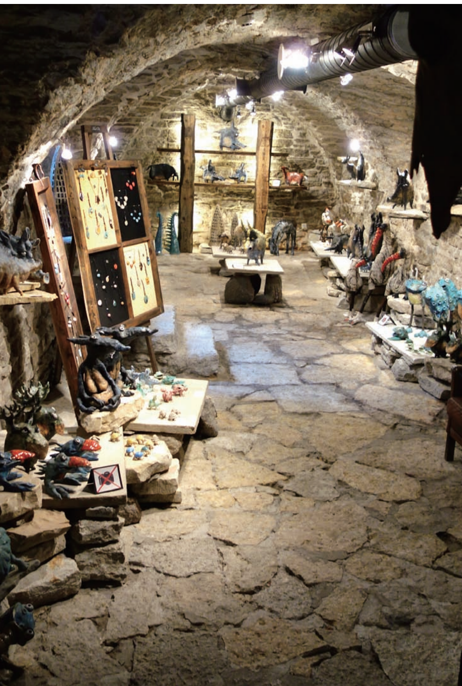
↑ 古城區中的陶工坊與展示賣店，猶如古堡般的老舊地磚給人時空錯置感

創作者在開幕當日進行行為藝術發表，利用日常用品作為首飾創作的媒介，於現場實地拆解零件、綁紮線材、潑灑顏料等，身穿白色防護裝的藝術家彷彿實驗室的科學家一般，在純白的場域中一點一滴的組構出物件，並於行為表演後將成品仔細排列，在藝廊做長時間的展出。