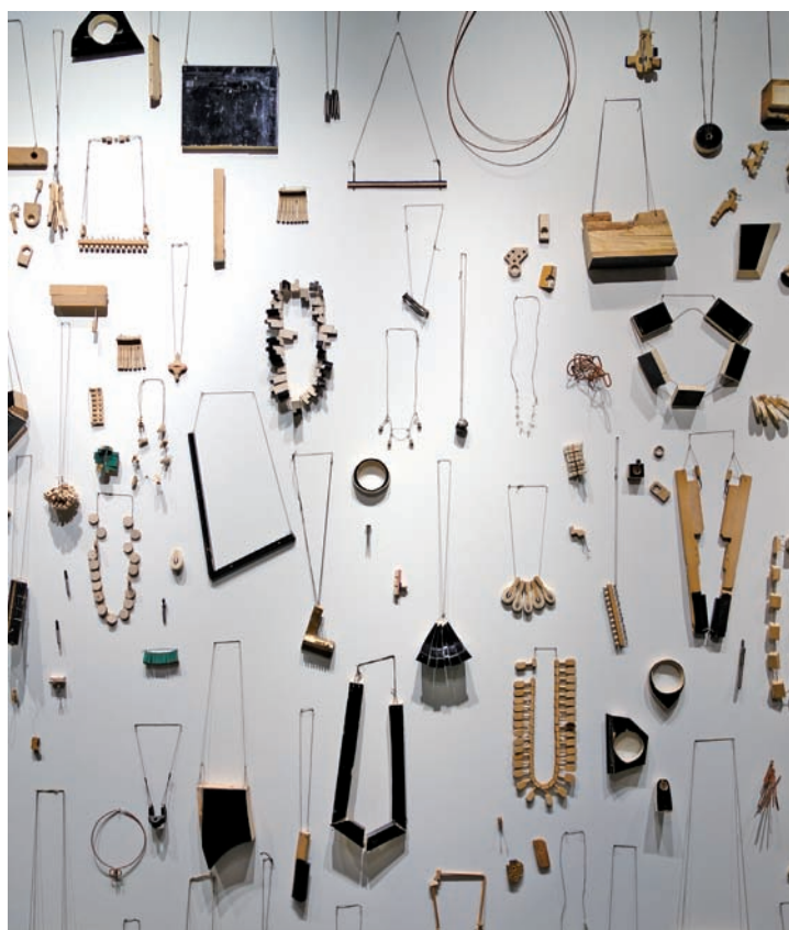
瑞典A5創作團隊拆解整台鋼琴，逐一製成首飾

自1979年起，愛沙尼亞舉辦首屆塔林應用藝術三年展，以展覽形式來統合並推動波羅的海各國之工藝美術，於此締結了應用藝術三年展的傳統，也在當時封閉保守的社會中提供另一種對當代工藝觀看的角度。三年展從1997年起，開始籌畫相關座談與研討會，