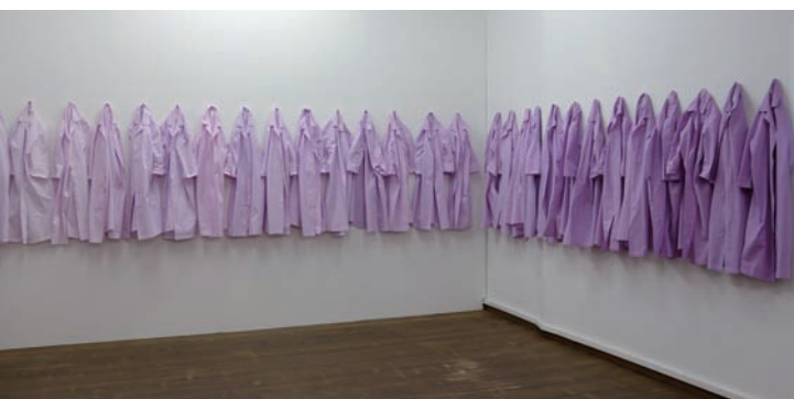
博物館二樓展間〈70 Cotton Smocks〉特展

●70件棉質罩衫〈70 Cotton Smocks〉：愛沙尼亞藝術家瑪莉特伊莉森（Marit Ilison）由環境周遭擷取價值與信息，透過手工染色，