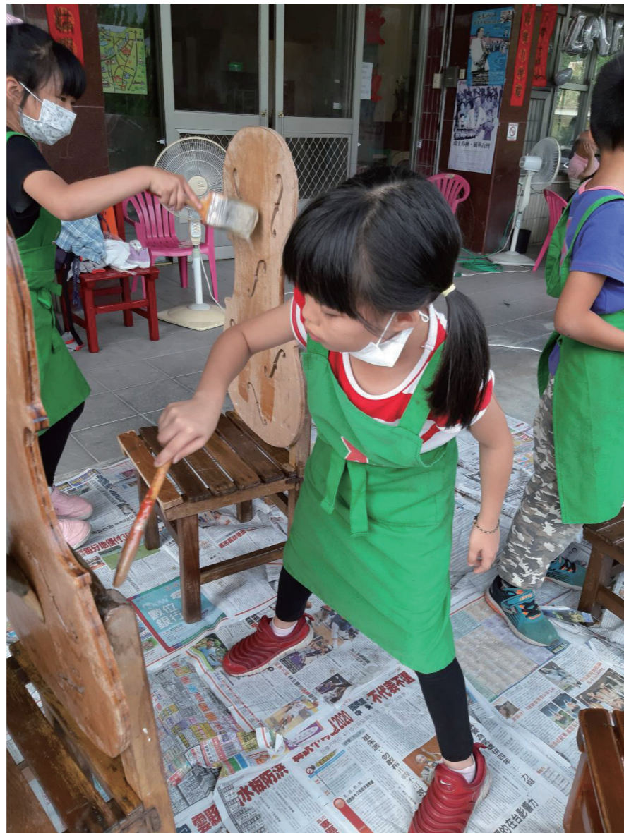
嘉義大埔和平村位在曾文水庫畔，兩位遠道教學的小提琴家帶著村民拉琴，更善用颱風帶來的漂流木製琴。小小年紀的孩童，也樂在製琴工藝中。

如何讓新的工藝設計成功地成為地方創生的觸媒，黃世輝參考日本社造的「風土理論」來說明。社區營造要成功，要有「風」，「風」代表外地來的創新，「風」會帶來新想法，刺激在地的觀念。但「風」終究會離開，所以還要有「土」；土代表在地與傳統，也就意指土生土長，並願意為家鄉努力的一群人。文化就像是一方之地的風土，它並非一成不變，而是以不斷滾動的方式發展。「風」如果能適應當地的人與環境，那麼自然會固著成一種文化，如果不能，那「風」就只是一陣風，吹過就沒了。因此，如能營造「風」加上「土」的合作，就有機會成功。如北海道置戶町的木作產業發展，該地林木茂盛，本以木材原料產出為主，但面臨進口木材的競爭危機，只能思考轉型。思及北海道同緯度的北歐國家，同樣盛產林木卻能成功發展家具設計產業，當地居民主動尋求東北工業大學的協助，邀請專業老師指導木工製作，隨即引發地方有志者關注。地方政府看