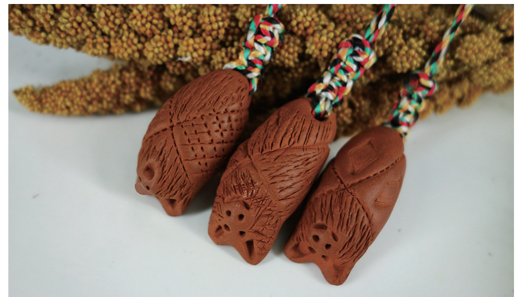
「馬佛陶」是花蓮光復馬佛社區的社區品牌，從「農村再生計畫」的支持開始，社區以在地黏土發展陶工藝，逐步為部落工藝產業燒出一片天。

在緩和人口減少與增加聘雇機會的目標導向之下，有時地方創生在實際執行上容易輕社造重雇用，輕文化重經濟，那麼地方創生是否可能造成地方創傷的不良結果呢？對此，黃世輝則認為，聯合國於2014年提出「永續發展目標」(Sustainable Development Goals, 簡稱SDGs) 即是告訴我們，一個正常的人類發展必須是在各方面取得共識與平衡。同理，從社區工藝永續發展的角度而言，我們不能只看到技藝和物件，而不去理解它們在社區所扮演的角色，以及能否持續延伸發展。傳統工藝中有所謂工作倫理與精神，不只是堅守自己的原則，也是工藝師「樂於此道」的一種自律追求；這裡所謂的「道」，不只是追求技藝的極致，應該還包括對人、對物的全面性關照，是「在看不見的地方有所堅持」的概念。在臺灣社會中，有許多隱藏在地方與人群裡的「道」，而這些「道」的發揚與突顯，也正是地方創生未來要永續生存的真正價值。🌱