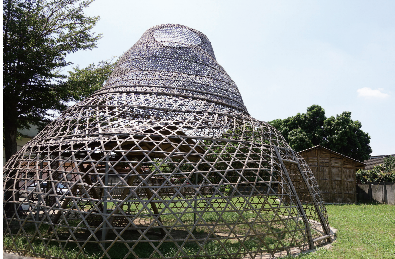
嘉義溪口天放社區過去竹編容器產業相當興盛，時代因素下漸失輝煌，竹編手藝在社區發展協會的努力下，以親近的竹管屋與大型編竹空間裝置，走入生活，進入社區。

念，認為工藝不能只看工藝品本身，更要能看到與當地文化有關係的社會網絡，亦即除了看見製作的人和成品，應更深入地認識整個生產鏈之中的材料、工具、工法與工序等社會合作關係，如此才能真正從整個工藝生態體系來理解工藝的價值。例如，一件竹編工藝產品，竹子原料從哪裡來？要去哪座山砍？山是誰的山？誰去砍？怎麼砍？這些問題都會連結到小社群的分工體系，如此互相緊密連結，才能成就最後的成品。又如，想認識三峽的藍染工藝，先得去思考藍染的原料哪裡來？哪裡有此種植物？又是誰在栽植、採集和擷取？黃世輝以苑裡蘭草工藝為例，也許當地面臨的首要問題，除了手藝的傳承或產品的推廣與販售，尚有種植蘭草的面積與原料取得日漸稀少等迫切危機。由此可見，近年來政府所提倡的地方創生，除了產業擴增與聘僱人力增加之外，也涉及地方參與的人力運用與熱情點燃，同時更應該思考如何有系統地串聯整體產業體系的發展，才是謀求地方共同生存與永續的關鍵。 (註4)