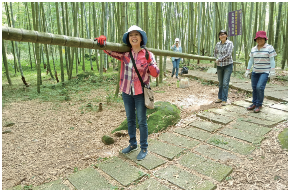
南投鹿谷竹林社區有著茂密竹林，過去竹掃把產業曾風光一時，帶來豐厚收入。現在重振製作工藝，並帶入生態旅行，讓人漫遊竹林中，也一探竹工藝之美。