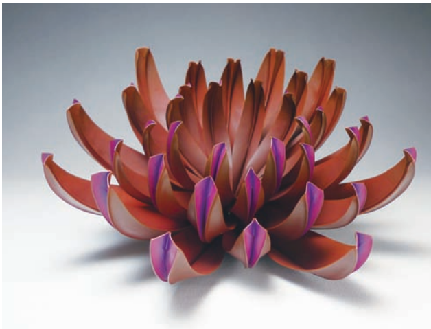
↑ 廖建清 擬真似幻系列 紅銅、化學染色、色鉛筆 紫：29×27×13cm、藍：28×25×17cm (2013清州國際工藝雙年展特別獎)

利用金屬摺形 (foldforming) 模仿花瓣不同大小的漸層排列，漸變尺度的層次讓花朵綻放時的繁複美感更具動態。