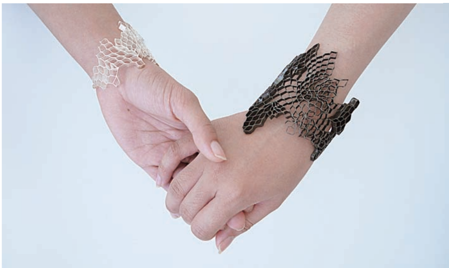
↑ 蘇筱婷 Transformation II (bracelets) copper、automotive enamel 8×7×6cm (2013清州國際工藝雙年展特別獎)

反覆探索蜂巢造型之創作變化，追求與體驗自己創作的潛能，完成一系列《歸巢》的建構。