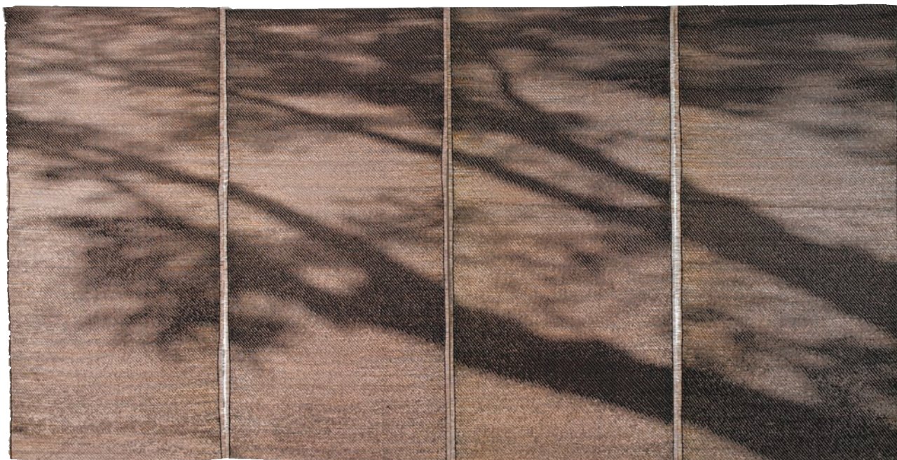
↑ 陸佳暉 常日一晨間·向北 絲光棉、苑裡蓆草、尼龍 數位緹花手織 330×173cm (2013清州國際工藝雙年展銅獎)

時間只朝「未來」的方向運動，如同織布進行的方向線性而單一；織物將隱藏在記憶中的片段，透過經緯紗線，顯影出記憶圖象。