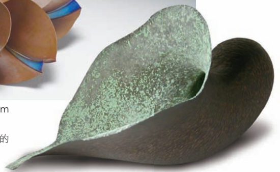
↑ 陳逸 綻放空間 (2013清州國際工藝雙年展入選)