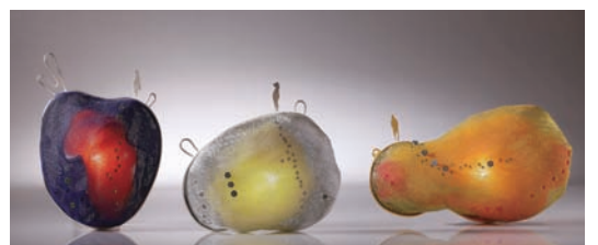
劉晏甄 他和他的世界 (2013清州國際工藝雙年展入選)

臺灣的金屬工藝在國際上一直都有著優異的表現，這次兩位特別獎得主蘇筱婷及廖建清，均是畢業自臺南藝術大學應用藝術研究所金工組的青年工藝家，本次雙雙獲獎，對臺灣的金工界是莫大的榮耀與鼓舞，也代表了臺灣的金工創作，蘊含了無限的潛能與實力。🌱