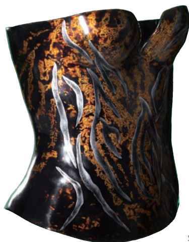
陳愷靜 獸紋變 (馬甲) (2013清州國際工藝雙年展入選)

韓國「清州國際工藝雙年展」是亞洲地區當前規模最大，也最具知名度的國際工藝盛會，在1999年首次舉辦時，參與的國家只有16個，在歷經2001、2003、2005及2007年圓滿成功地落幕之後，已經成為亞洲地區舉足輕重的雙年展之一，而2009年辦理第六屆，與會的國家多達53國，參與的藝術家超過三千人，其中不乏國際級的知名工藝大師，「清州國際工藝雙年展」自此成為全世界矚目的工藝盛事，韓國的工藝也同步晉身全球化的行列。舉辦至2011年的第七屆，規模日益擴大，涵蓋的活動有競賽、工坊、研討會、示範表演、音樂會、服裝秀等等，內容豐富的程度不亞於國際間其他知名的藝文盛會。