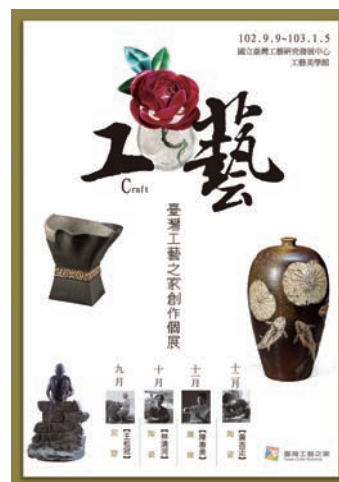
臺灣工藝之家創作個展海報

工藝家運用不同的技法及本身生命的歷練淘洗，更讓作品富含本土文化內容及現代生活元素，更煥發迷人的亮彩。邀請您來體會豐富心靈感官、美好的工藝饗宴。🌱