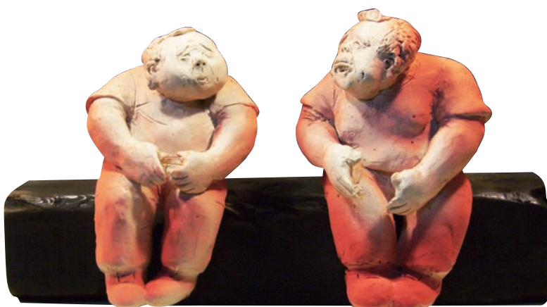
張舒嶠 退休生活 2012

透過概括寫意變形的手法，精確表達出張舒嶠個人獨特創作風格。立體雕塑與釉彩間的結合，加強了虛與實之間的對應關係，進而使觸覺及視覺知有了強烈的轉化。作品中強烈表達出張舒嶠對世間的