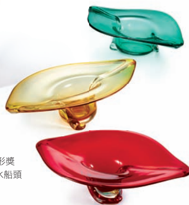
→2012臺灣優良工藝品造形獎 春池玻璃有限公司 渡水船頭