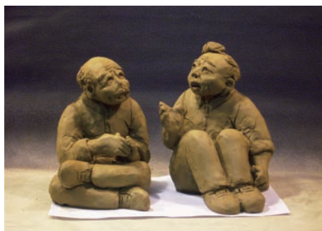
張舒嶠 坐久卡世麻 2012