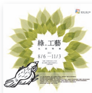
綠工藝生活特展海報

此次展覽邀集了十餘位竹、藤、木類「臺灣工藝之家」工藝家聯合展出，融合臺灣傳統文化工藝及當代創新元素，創造傳統再生的概念，藉以達到「綠工藝」的生活思維。🌿