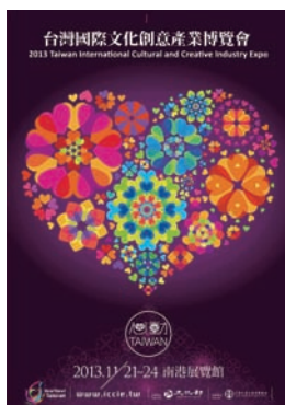
2013臺灣國際文化創意產業博覽會海報

由文化部主辦、中華民國全國商業總會承辦的「臺灣國際文化創意產業博覽會」，已成為臺灣一年一度國際級大型文創展銷盛會，上屆（2012）創下15個國家地區、525個企業單位、952個攤位展覽規模，四天展會吸引上千名買家、突破8.4萬人次觀展，交易金額累積達新臺幣2.59億元佳績。