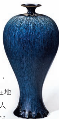
←2012臺灣優良工藝品美質獎 鴻福陶藝坊 繁星熠熠

良工藝品入選作品，透過多元媒材如染織、陶瓷、玻璃等作品展示，向大眾宣傳臺灣在地優良工藝技術及人才，並傳達工藝與生活結合概念。🌱