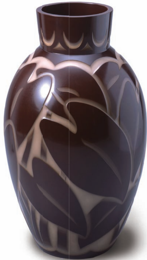
磯井如真 日本「雕漆」技法漆器 「2018臺灣香川漆藝交流展」展出 高松市美術館藏

山中公隨著二次世界大戰日本撤臺後返回日本，回國後不久仙逝，這段臺日漆緣再次連結在數十年後，2013年7月中公的女兒山中美子，將父親生前製作的162件漆器暨文物捐贈給工藝中心，她認為山中公在臺灣生活最久、一生奉獻給這裏，這些文物要留在臺灣。此一善舉，為臺日漆藝流傳佳話，也開啟了後續交流活動的契機。誠如東京藝術大學校長宮田亮平所說，山中公猶如孕育臺灣漆藝的母親，而近年來臺灣漆藝在時代更迭中隨著產業興衰，經由工藝中心逐步推展與技藝傳習，已在國際上有亮眼的表現，因此日本香川縣政府在意識到山中公對於臺灣漆藝的貢獻下，期望工藝中心能促成本次的交流活動。