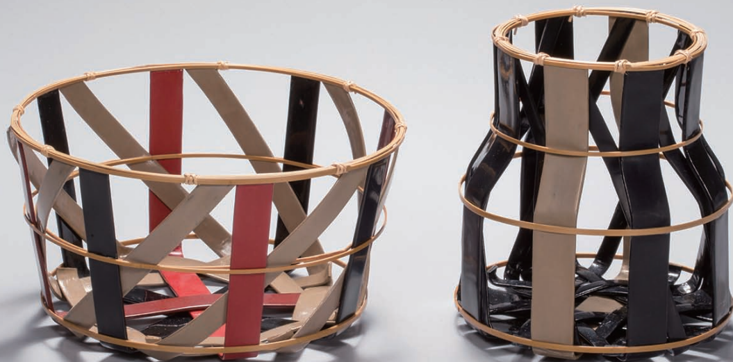
設計師：吉行良平；工藝師：林美如 漆藍 臺日設計合作研創作品 「2018臺灣香川漆藝交流展」展出