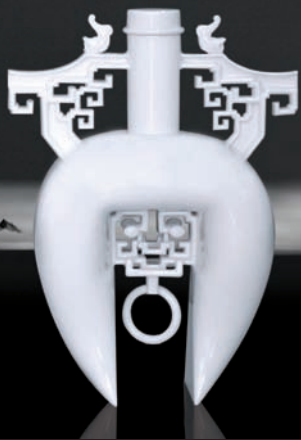
王俠軍委託設計作品 光耀星月