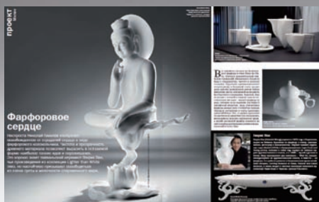
國際媒體報導八方新氣

「八方新氣」則展出品牌成立十年來最受歡迎的生活瓷器精品，除了全以手工製作外，更顛覆傳統瓷器渾圓封閉腔體造型，以平面、稜角、懸空、方正等大膽角度變化，藉由時尚、簡約、意象的概念重新塑造，打造新東方生活美學。