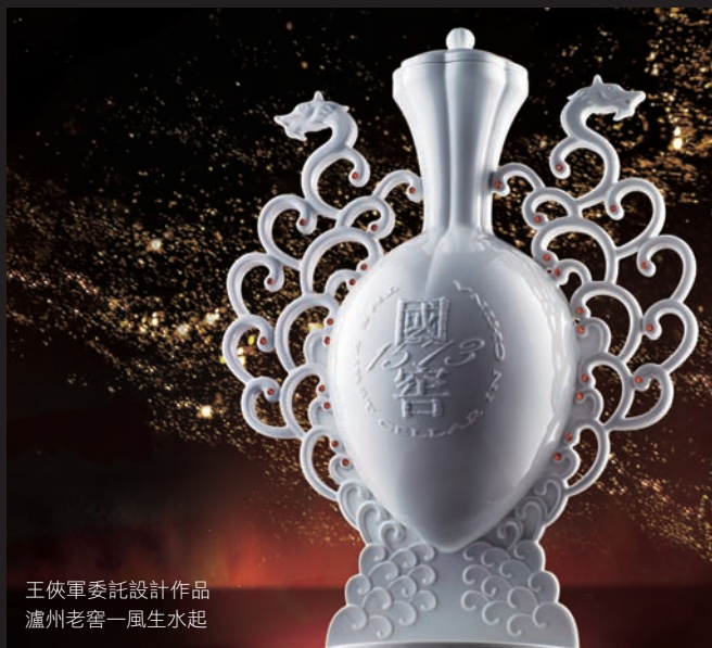
王俠軍委託設計作品 瀘州老窖—風生水起