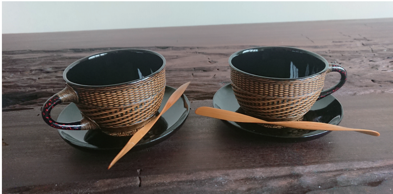
分享 / 竹杯 籃胎漆器 竹、天然漆、藤 12×12×6cm