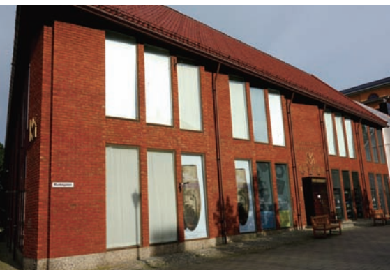
第17屆德國哈瑙銀器三年展特別巡迴至挪威特隆海姆國立裝飾博物館博物館展出

無論是傳統技藝或當代工藝思潮，德國在世界工藝舞台始終占有穩健而先驅的地位。自1965年起，德國金匠協會（Goldschmiedekunst）及德國哈瑙金工之家（Deutsches Goldschmiedehaus Hanau）首度舉辦哈瑙國際銀器三年展Hanau International Silver Triennial，透過邀集、徵件，匯聚世界各地知名的工藝創作者共襄盛舉，評選後更進行重要的展覽巡迴，企圖促進當代銀器發展與革新。本年度進入第17屆，此展亦已成為世界公認的重要工藝競賽之一。