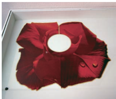
Gijs Bakker 〈Dew Drop〉 1982, Holland。荷蘭藝術家 Gijs Bakker的經典作品，與眾多 歐美金工大師傑作共同收藏於此 博物館中。

行旅中讓人驚嘆的，除了博物館中經典的藝術品，更多是街邊俯拾即是的生活工藝，從廣場市集中甜美卻精緻非常的手工小物、處處可見的藝廊店鋪，到當地機構特意安排的免費石雕體驗等，政府有計畫的從日常與教育中讓民眾親近工藝，讓歷史與生活趣味緊密連結而不斷裂，可預期在長久的建設下，不僅能奠定民眾對於傳統藝術的關懷，也能進一步藉由當地傳統文化特色來推動商業觀光。🌱