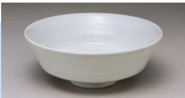
白瓷龍紋折腹淺碗 元 楓府窯 5.3 × 13 × 4.5cm