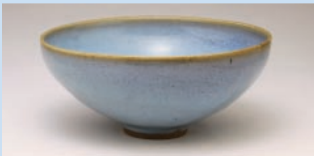
天藍紅斑紋深腹碗 元 鈞窯 7.8 × 18.8 × 5.7cm