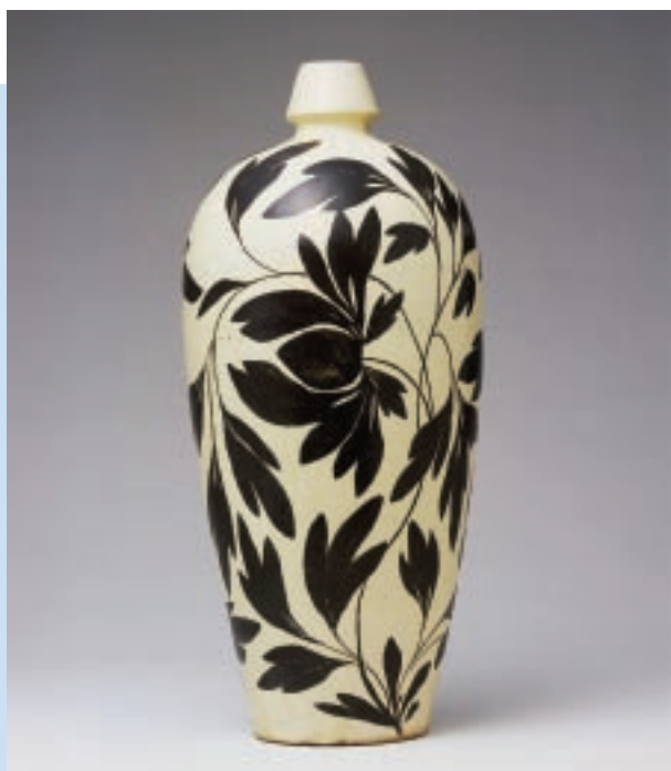
白地黑釉葉紋小口瓶 宋 磁州系 34.5 × 3 × 9cm

有鑑於洪先生豐富的收藏，國立歷史博物館繼2004年舉辦其珍藏精品「百代昌吉——黑釉、磁州、吉州窯」特展後，特於今年再度舉辦「玉潤玄光——宋元名窯瓷器展」，展出洪先生的收藏作品約80件，期望藉此展覽以饗國人，並發揚中華文物之光華與內涵。