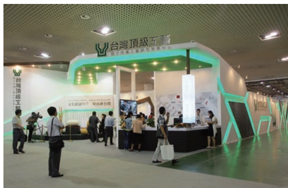
2013兩岸廈門文博會臺灣頂級工藝展區本次展區擁有最大及最佳位置