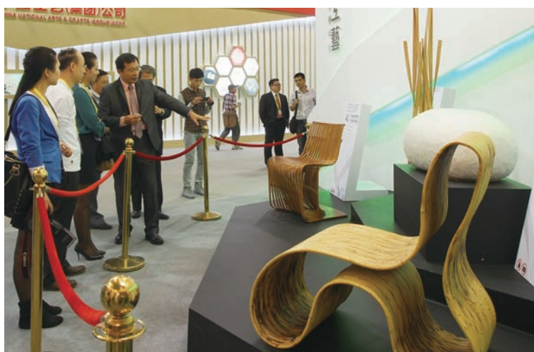
↑國立臺灣工藝研究發展中心 許耿修主任介紹「Yii」參展 作品

粧佛、竹雕及複合媒材等十大領域；另外也首次在大陸地區展出工藝中心在國際重要商展中獲得好評的「Yii」品牌四件研發作品，此四件作品也在今年9月受義大利知名品牌Gucci邀請，於臺北101購物中心「Gucci古董竹節包經典展」共同展出，受到相當的矚目，所有產品皆強調臺灣設計及製作，因此「文化創意MIT·時尚新臺灣」是本次展覽的核心主軸，同時將參展定位為：