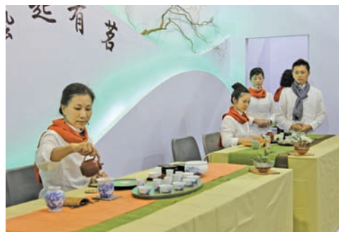
臺灣茶藝現場示範展演