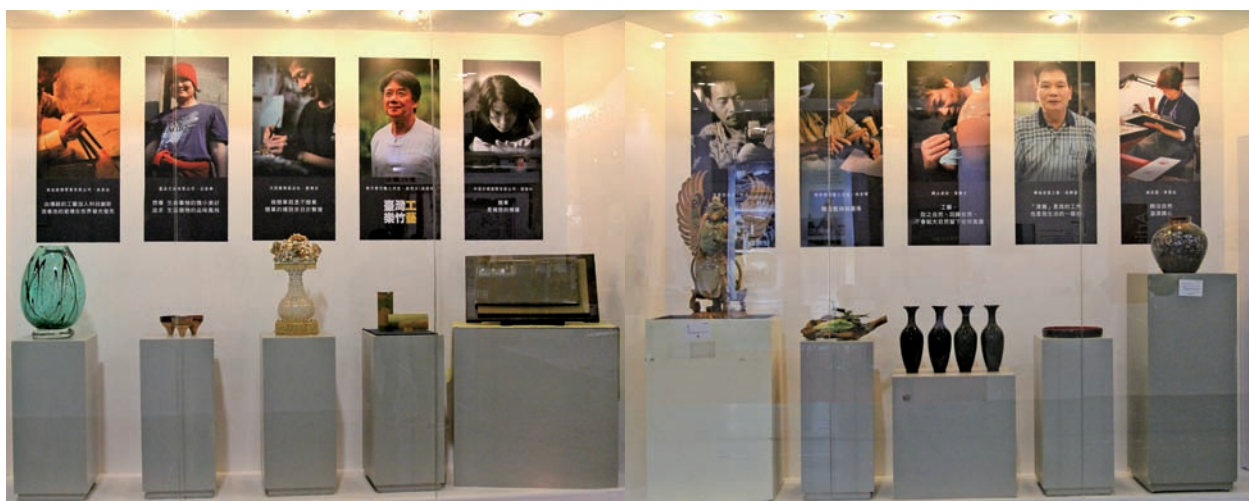
本次邀集臺灣15家頂級工藝廠家共襄盛舉