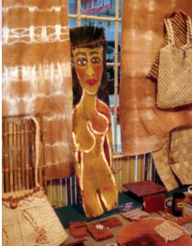
社區工藝可以發展為在地獨特的美學詮釋。圖為嘉義阿里山來吉部落的素人藝術家用地素材所製作出的生活工藝品，搭配藝術創作型塑出一種獨特的美學。