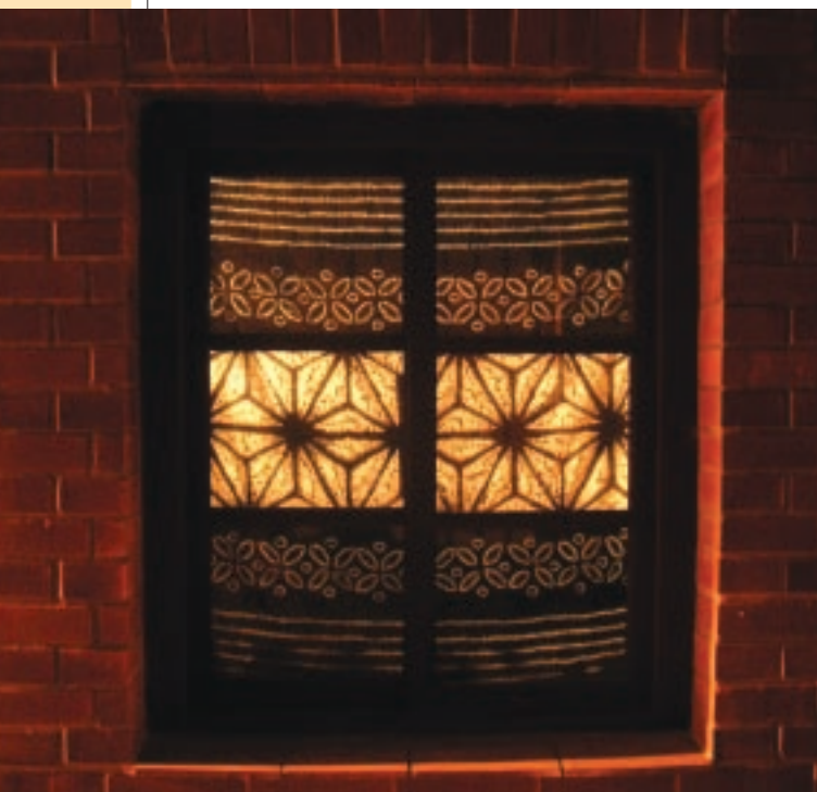
工藝生產源自於生活所需，這是內發型社區產業的特徵。圖為三峽藍染成了最具在地美學的住家窗簾。

臺灣社區工藝產業如今面臨兩大競爭，一方面是中國大陸及東南亞低成本的手藝品傾銷，一方面則是歐、美、日高度設計感精緻化工藝的壓力，想要在夾縫中突破重圍，我們應該找到屬於自己的出路。首先，不可能再走回頭路用低價的勞工或是原料來壓低成本，這個時代已經過去了，而是要更进一步去發現工藝的核心價值，而不只是強調它的傳統功能性；第二，從市場的角度來看，如何去滿足、了解未來消費主流需求？現在製作的手藝，必須為未來設想，而不該一味追求當下的流行；第三，臺灣跟中國大陸、日本的生活型態並不相同，我們處於一個多元生態、多元族群與多元文化的島嶼，且不斷有新文化的加入，這是臺灣獨特的優勢。因此運用開放的胸襟與多元的學習機會，讓大家能在地產生撞擊，進而形塑出一種有別於其他地方的特殊文化情調且生生不息，將會是臺灣工藝產業發展較具利基且可行的