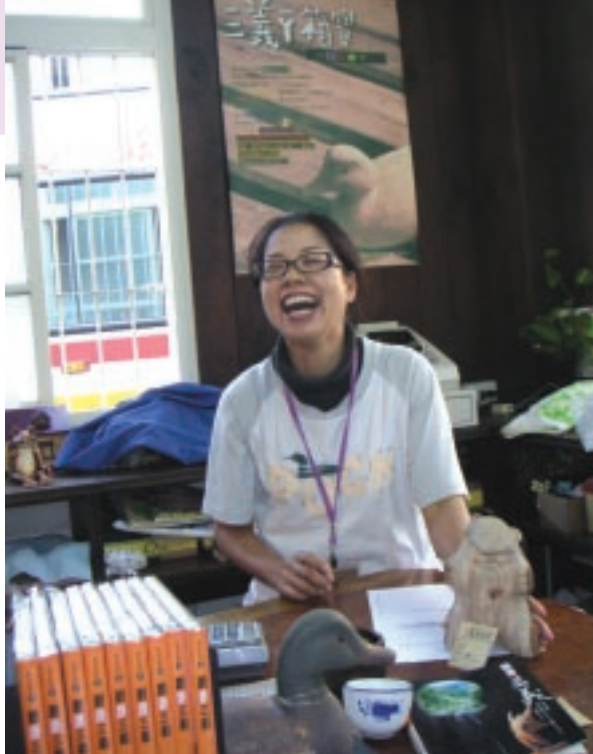
苗栗三義的木雕業者——雙峰實業，從傳統的代工外銷轉型為體驗經濟（以丫箱寶為品牌名稱），靈魂人物阿冠笑開懷，似乎產業轉型滿成功的。