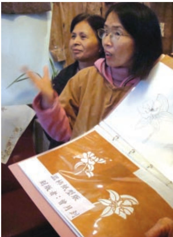
社區工藝產業的發展，奠基於社區居民共同參與學習。圖為新竹新埔社區媽媽們運用當地特產柿子為原料，共同參與學習製作柿染。