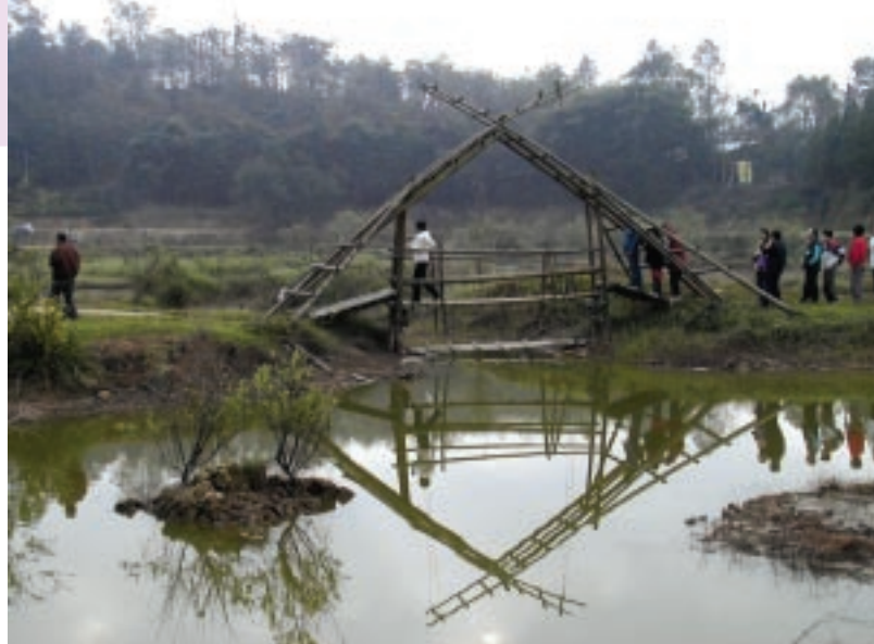
南投桃米社區的居民用當地竹材親手搭建的生態遊戲橋，讓遊客有難忘的體驗，還想再來！體驗經濟已然成為產業轉型趨勢。