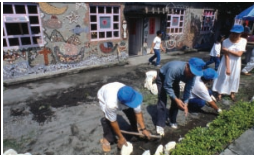
白米木屐產業的發展是先從社區居民捲起袖子打掃自己的環境做起。(上圖)