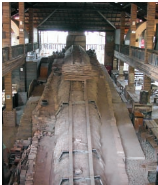
傳統的產業設施是發展體驗經濟的重要資產。圖為南投水里蛇窯，其觀光體驗部份反倒成為窯業收入的大宗。

也就是產品的個性、文化傳統性、地方特殊性，包括工匠或藝術家的獨創性，所強調的是產品的精神價值內涵，這些正是文化工業所沒有的質素。就產業獲利的模式而言，文化產業也呈顯出其地方的特質。文化產業不像以資本家及勞工關係為主的工業文明，它的利潤不會集中到少數特定資本家手中，反而是稀釋到所有在地居民身上。文化產業並不似工業模式以掠奪土地資源和污染環境作為代價，文化產業建立在與生活環境的彼此依存關係上，因此強調保存傳統和地方的魅力，發掘地方的創意與特色，建構「在地文化」的品牌形象。所以我們在談工藝產業的發展，就必須思考究竟工藝產業適合「市場化」的經營模式亦或是「地場化」的經營模式，是「文化工業」抑或是「文化產業」。