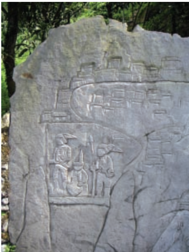
屏東沙卡蘭部落用石雕刻紀錄族人的生活習俗，這樣的社區日記，是吸引人來此探訪的致命吸引力，可說是一種地場化產業經營的模式。

臺灣近年發展文化經濟的歷程，肇始於這些幾年來文建會所推動的社區總體營造政策中以「文化產業化」與「產業文化化」的理念。這樣的「文化產業」不同於「文化工業」，「文化產業」完全是依賴個別的獨特性，