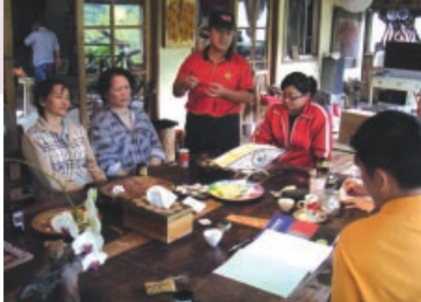
嘉義阿里山來吉部落的村民們共同參與討論，學習如何運用在地素材製作出族人生活所需的工藝品。