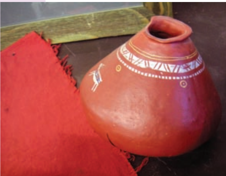
屏東三地門排灣族的素人藝術家所製作出的生活工藝品，獨特的造型與顏色，形塑出在地社區美學。