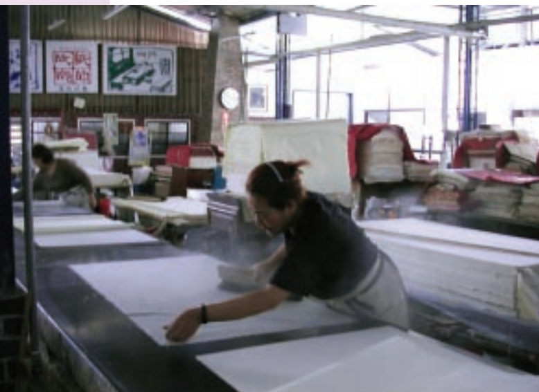
社區曾有過的造紙工廠亦可轉型為觀光體驗型的學習型產業，圖為埔里廣興紙寮的手抄紙造紙過程，成為該工廠最大的賣點。