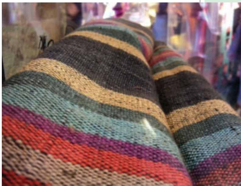
社區工藝的發展應不斷向傳統對話學習，以建構獨特的社區美學。圖為桃園復興鄉讀法阿泰雅部落的傳統織布。