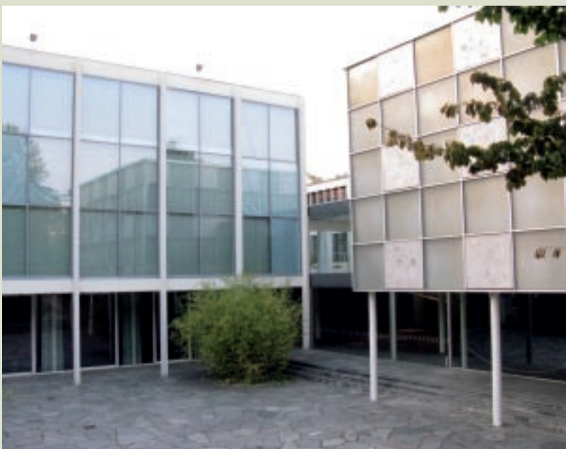
普佛爾茲漢首飾美術館近觀