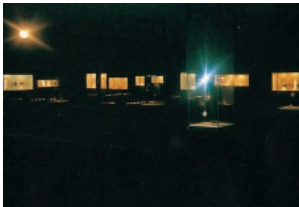
照明昏暗的首飾美術館內部