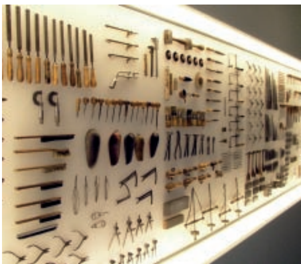
飾品製作工具陳列櫃

定於擁有財富權勢者、聖職者等身分者佩戴。貴族階級對裝飾品的嚮往，同時也是其地位權力的炫耀。以這樣的憧憬為背景而製造的項鍊、戒指和各類裝飾品，都使用寶石與金銀，並運用精緻的工藝技術。不論是以神話做題材、自然花草動物的描寫，都鑲嵌著鑽石及翡翠，其作品之完美，使人不僅感受到富貴與權勢，也能看見創作這些作品的專家的氣勢、旨趣及卓越的技術。