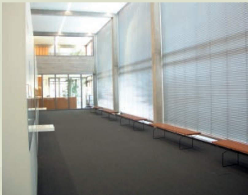
普佛爾茲漢首飾美術館內部