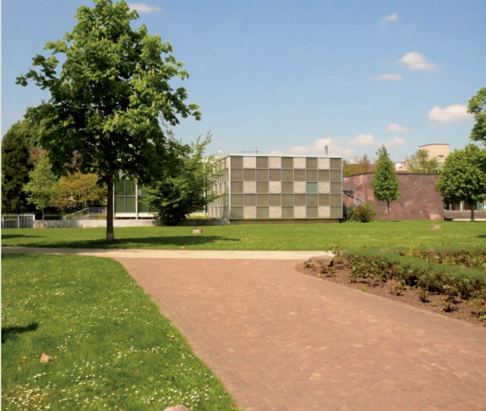
位於黑森林邊緣的普佛爾茲漢首飾美術館