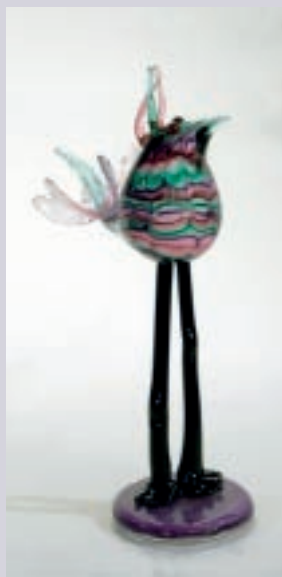
預定於明年1月參加紐約國際商展的展品

在冬夏兩季輪番登場的「美國紐約國際禮品展」，由於舉行次數密集，且位於時尚核心的紐約，可說較之其他商展來，更為更貼近每季瞬息萬變的世界潮流，因此亦是國際廠商與世界接軌的最佳平台之一。