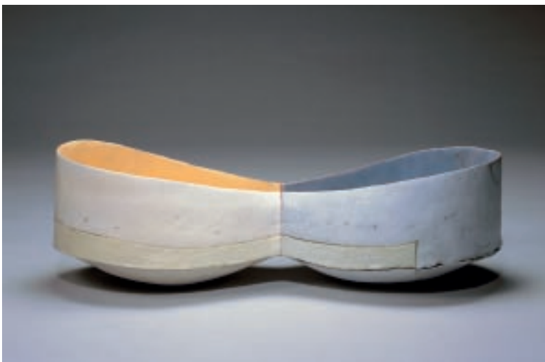
Meredith Knapp Brickell（美國） 聚合 76×28×23cm 陶土、陶板 2007 銀獎