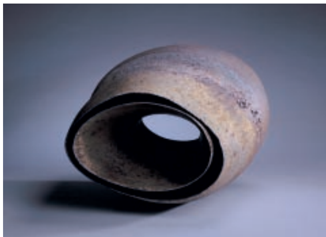
蔡宗隆（臺灣） 寧靜的溫度-5 54×50×45cm 陶土、土條 2007 銅獎

回頭想想，陶瓷界其實一直有自己的遊戲規則與場域；從古董買賣到新產品的生產、展售，以及相關的陶瓷博物館經營連成一氣，逐漸形成了一個整體。這麼一來，創作者有其他媒材或觀念的作品，會自動找其他場域展出；而其他領域的藝術家也不會太關心或參與陶藝