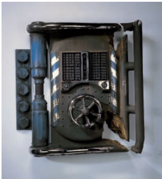
Steven Montgomery（美國） 安全缺口#2 86×28×91cm 2005 陶土、白金光澤釉、銀釉、鎢黃釉 優選