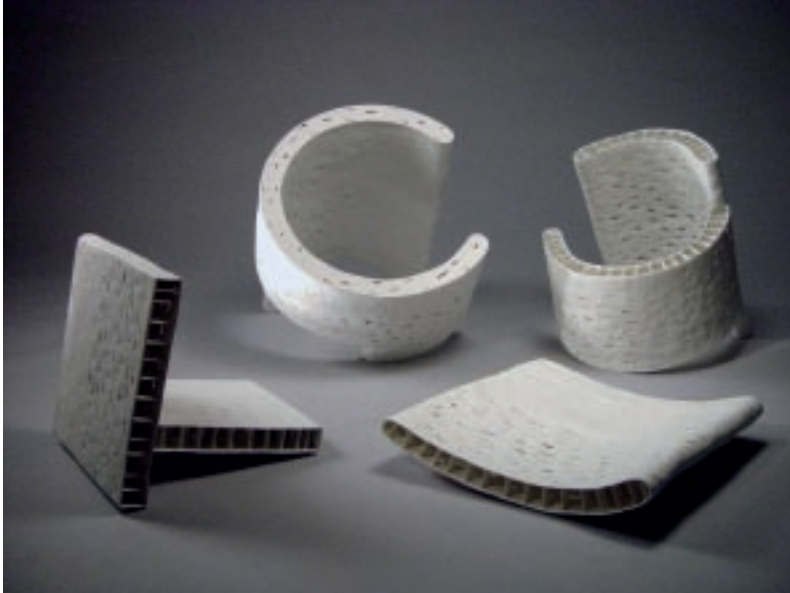
李春福（南韓） 隱蔽空間 140×140×60cm 瓷土 2007 金獎