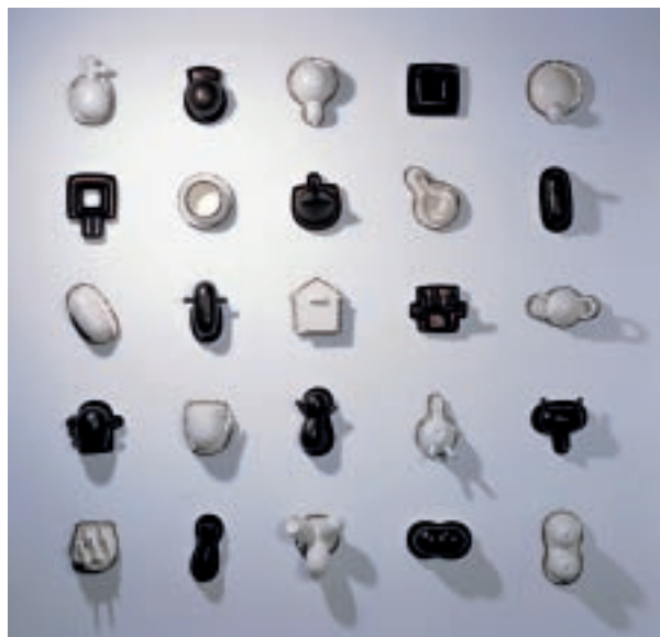
朱芳毅（臺灣） 物件記憶·記號·紀錄 150×22×150cm 雕塑土、無光白釉、金屬釉 2007 首獎

因此，主辦雙年展的鶯歌陶瓷博物館有心改變，發展新的可能性和特色。今年邀請到國際策展評審資歷豐富的澳洲陶藝雜誌主編Janet Mansfield，主持評審結束後的討論會。會中針對展覽制度，評審們分別提出許多面