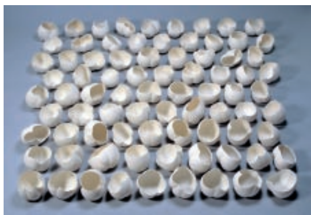
青木良太（日本） 珠寶 150×150×18cm 骨瓷、釉彩 2007 優選

回頭來看，縱使當代陶藝創作，是從陶瓷媒材發展而來，仍是多方與當代藝術創作思潮互動之下的多元創作之一，不應自外於當代藝術的發展。以此角度出發，博物館要策劃當代陶藝展賽（尤其是策劃性展覽）時，其實可以跳脫媒材的限制，廣納各種創作發想的可能性，或許也會是開拓陶藝多樣性的契機。另外也可以與其他美術館合作進行，讓創作者也能像這次雙年展一般，除陶瓷之外也能與其他媒材的創作者、藝評、美術