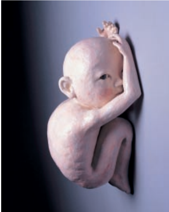
羅貞熙（南韓） 陶孩子 25×22×42 cm 陶土、化妝土、透明釉 2007 優選