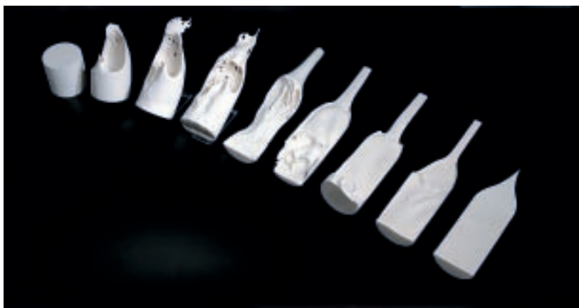
巫鍵志（臺灣） 看不見的瓶子#2 150×49×30cm 瓷土、莫來石 2007 銀獎