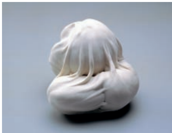
Joseph Madrigal（美國） 餃子第三號 11×12×10cm 瓷土 2007 銅獎