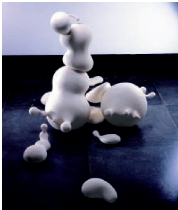
胡慧琴（臺灣） 請聽我說關於移動時的遺忘與記憶 120×90×80cm 雕塑土 2007 優選