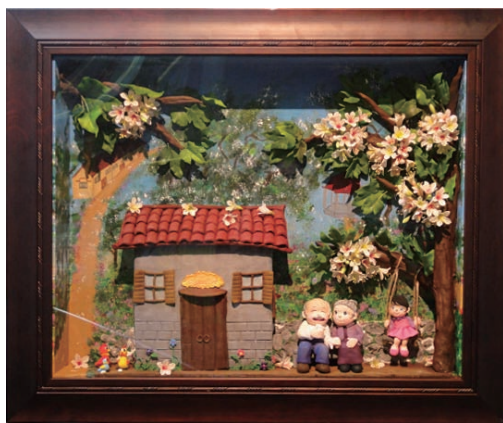
黃麗璇 執子之手，與子偕老 黏土

黃麗璇老師說：「流『黏』忘返——大 人小孩不變壞。讓大家一起感受黏土之 美。掌上乾坤——萬物靜觀皆自得；心 靈環保——陶冶性情滋潤心靈；知行合 一——將心靈的感動化成具體的創作；皆 大歡喜——獨樂樂不如眾樂樂。」🌱