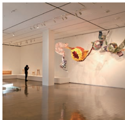
日本「金澤國際工藝三年展」展場

特別策劃「日本工藝之都：金澤國際工藝三年展臺灣交流展」，展出包括日本區及臺灣區約50件重要展品，針對工藝精神與設計傳承詳盡介紹，實踐描繪日本與臺灣工藝創作上的脈絡與光譜，期望穿梭在當代藝術與設計之中，呈現日本與臺灣當代工藝發展與當代設計的工藝樣貌。🌱