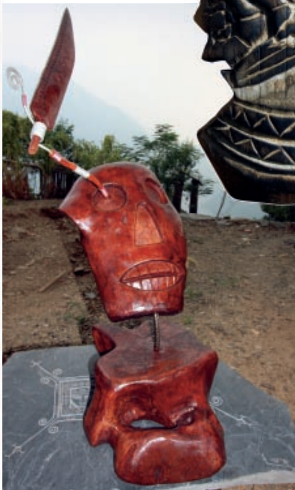
排灣族峨塞的木雕作品