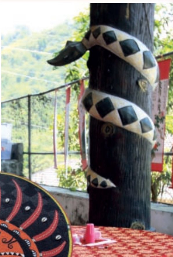
排灣族喜宴場合的蛇紋柱裝飾，以強化文化屬性和位階。 排灣族雷恩以細珠鑲嵌的排灣族傳統人頭紋設計（左）

然而，目前原住民傳統工藝的生產與表現，牽涉到變革的因素複雜，例如技術方面的改進，包括新式機器及工具的應