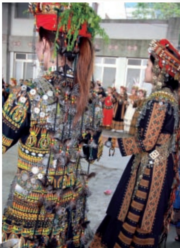
排灣族婚禮舞蹈場景 魯凱族巴勒發燻色木刻作品（左）

基本上原住民是愛美的族群，各族群傳統中的服飾、配件、用品物件具有多元的裝飾性質與美化表現。這些美感是依存於生活脈絡與儀式行為的祭典、喪禮、婚禮等展演當中，可看出審美判斷與情感和文化尊榮之間的密切關係。以排灣族和魯凱族等階級社會而言，美感是緊緊連結在繁密嚴謹的社會結構以及所衍生出的尊榮民族性格當中，再透過各種祭儀儀式、盛裝服飾、歌舞、口鼻笛吹奏和雕刻等藝術實踐行為，被包裝、表達、接收、交流與傳遞。不論文化展演或是視覺的形式與內容元素，在藝術視覺場域的展示與交換作用下，都被族人所