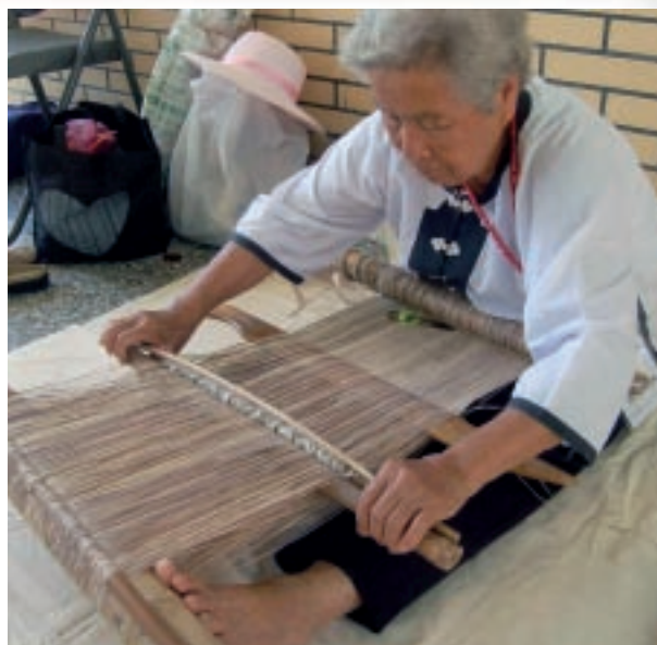
噶瑪蘭族香蕉絲編織

地利用環境資源進行工藝製作，以藤蔓、植物纖維為材，製作藤編、籃編、網袋、器皿等日用品，男性族人也常借助簡易刀具，雕刻製作杵臼等生活工具。手工製作是原住民傳統工藝之特質，從原料採集、媒材整理、製作均借助手工，以噶瑪蘭族傳統香蕉絲編織為例，整體香蕉絲材料的製作工序就相當費時費工。有些原住民族群傳統工藝有特殊的製作習慣，製作者的社會屬性及性別亦有區隔，像是阿美族古法製陶者均為女性，製陶過程當中必須遵守行為規範及禁忌，而傳統排灣族階