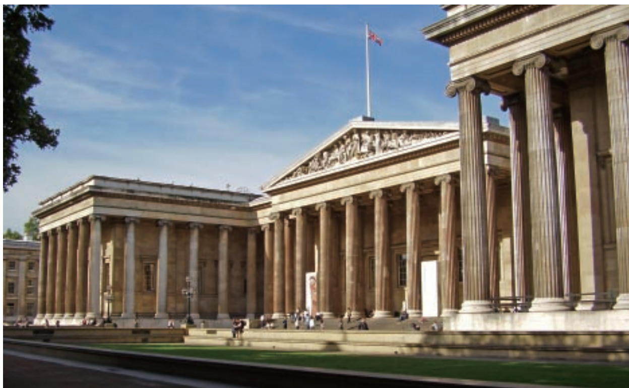
倫敦大英博物館外觀

英國最大的綜合性博物館——大英博物館（British Museum），於1753年設立於倫敦。館內收藏豐富，涵蓋埃及藝術、希臘羅馬藝術、西亞藝術、歐洲中世紀藝術、東方藝術、民族學等部門。在民族學的收藏中，印度與巴基斯坦的刺繡工藝，特別是出自女性手工刺繡飾布，數量豐富而精美。