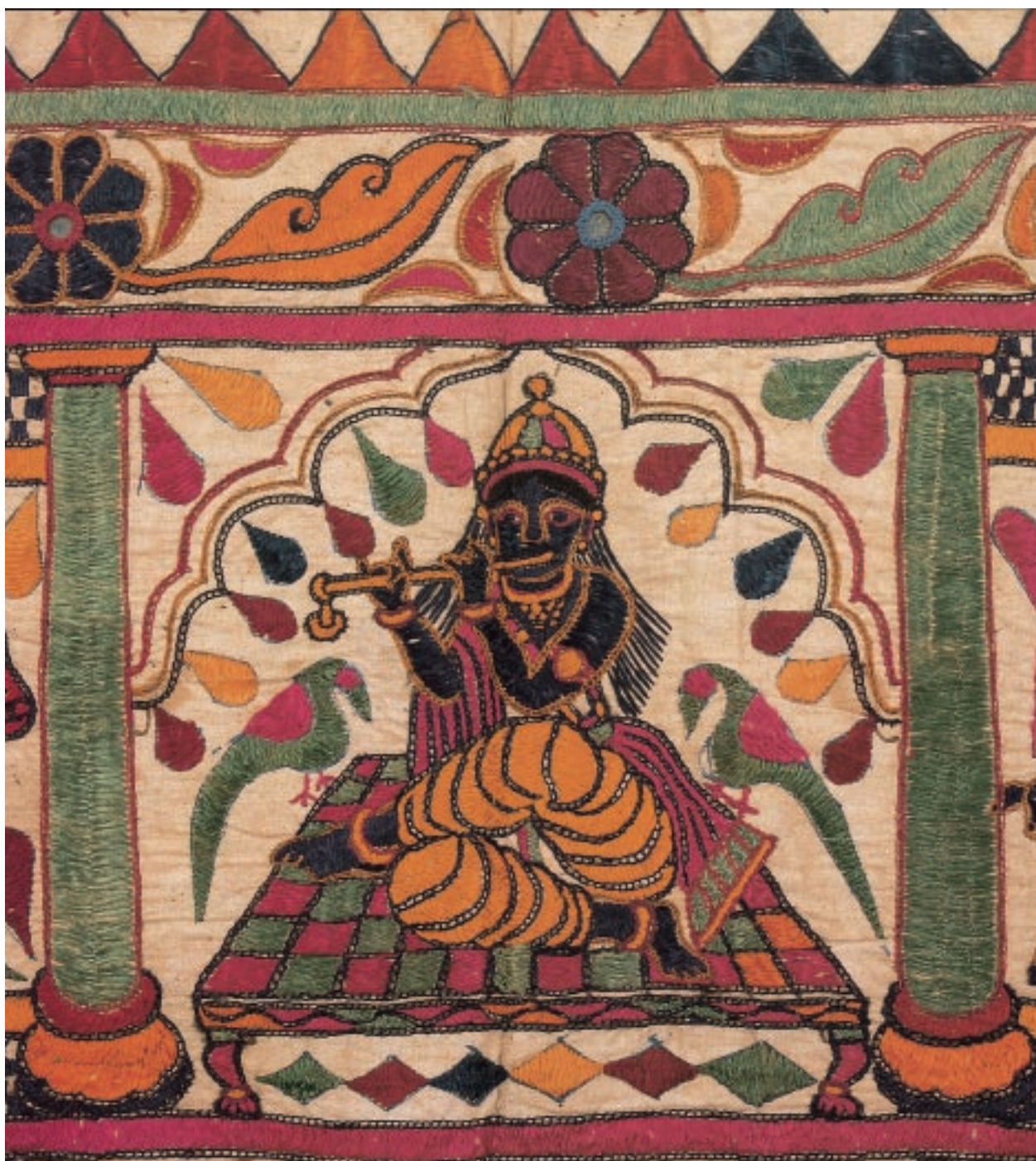
① 印度刺繡 門簾 66×128cm 大英博物館藏

此門簾為在白木棉布上以彩色絲線刺繡圖案而成，為特別用於喜慶節日的門簾，有時也裝飾於寺院。中央的圖案為吹笛的克里希納神（Krishna），兩側為象徵大地的聖牛圖案。