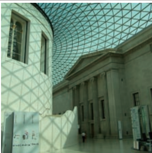
大英博物館的中央通廊

印度刺繡表達出印度大地與民族的獨特風格，有如萬花筒一般的色彩洋溢在他們的刺繡和衣飾上。在印度的畜牧民、游牧民、自給自足的農民生活中，尤其是女性，刺繡是其人生中不可或缺的一部分。傳統上，印度女孩從六歲就開始學習刺繡，少女跟隨著母親或家庭中的女性學習傳統的刺繡技術，他們自己穿著的服飾多半是自己刺繡織成的。製作一件服飾最少要費一年時間，而以卡茲地方的女性為例，她們通常會耗費五至六年的時間，完成一件有如一生珍寶的刺繡服飾，而用以刺繡的不同素材與色彩，也是其社會階級與身分的證明。以下即選介大英博物館珍藏的數件印度民族刺繡作品。🌿