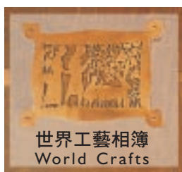
世界工藝相簿 World Crafts