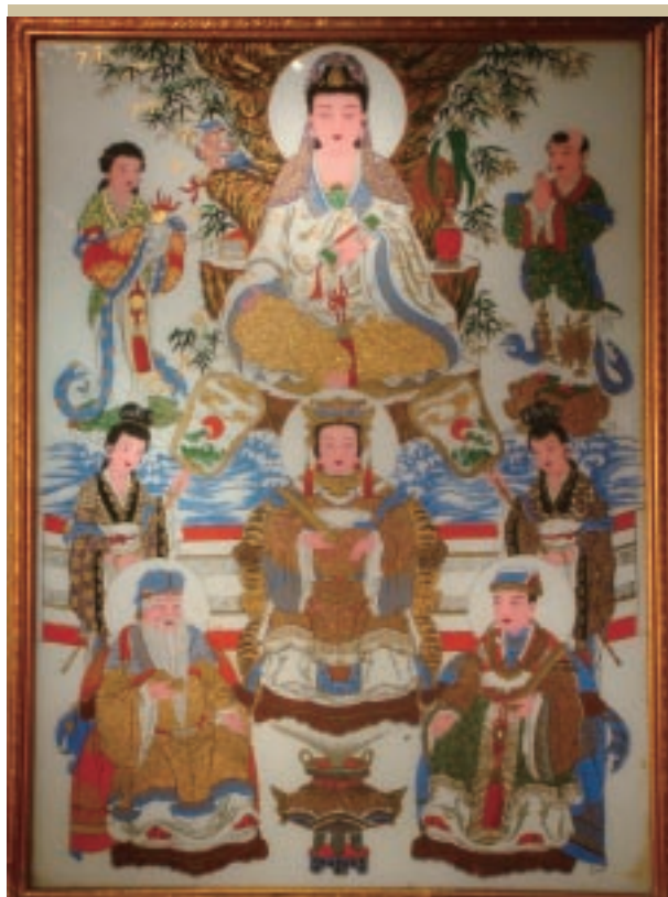
「廳堂五神」的彩繪神像群組

土地公的民間信仰源自於對大自然的崇拜，古時候人類對宇宙、天地、山川、河海甚至生物（如動、植物等）、無生物（如大石頭、器物等），認為有超越人