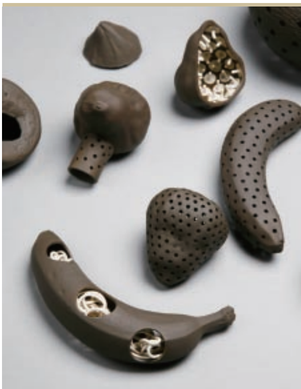
尤雅容 黑皮Happy的造型遊戲 第六屆臺北陶藝獎得獎作品

「成就獎」是表彰長年致力於陶藝創作，並在教育、推廣、研究、發明、創造、美學、藝術性等方面取得卓越成就，為臺灣陶藝發展作出寶貴貢獻者。本屆得主孫超先生（1929-），畢生致力於釉色開發與創新，並將研發出來的精彩釉色轉化為藝術語彙，呈現在容器或陶板上。其勇於創新、超越自我的精神，使得他的陶瓷藝術成就備受國際推崇，經常受邀於國內外各大博物