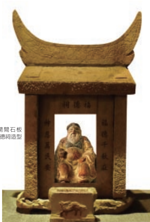
單開間石板 福德祠造型

類的神祕能量，由敬畏而起崇拜之心。土地公是土地之神，古時人們為感謝土地生長萬物而加以祭祀，所以土地公原為自然崇拜。從居家常見的彩繪神像群組背景圖中，可以發現土地公信仰很早就進駐了家戶戶的廳堂，很快地擴大到村里社區的互動，因此民間俗話常說：「田頭田尾土地公」。