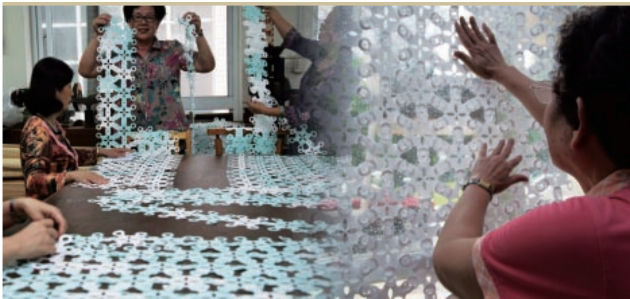
「工藝舞台」展出女性工藝創作者的作品