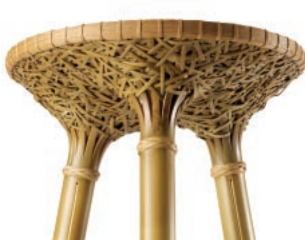
Bambool 的細部設計，將前衛設計概念與精湛竹藝技巧完美呈現，力與美的線條，交錯出沁人的美感。