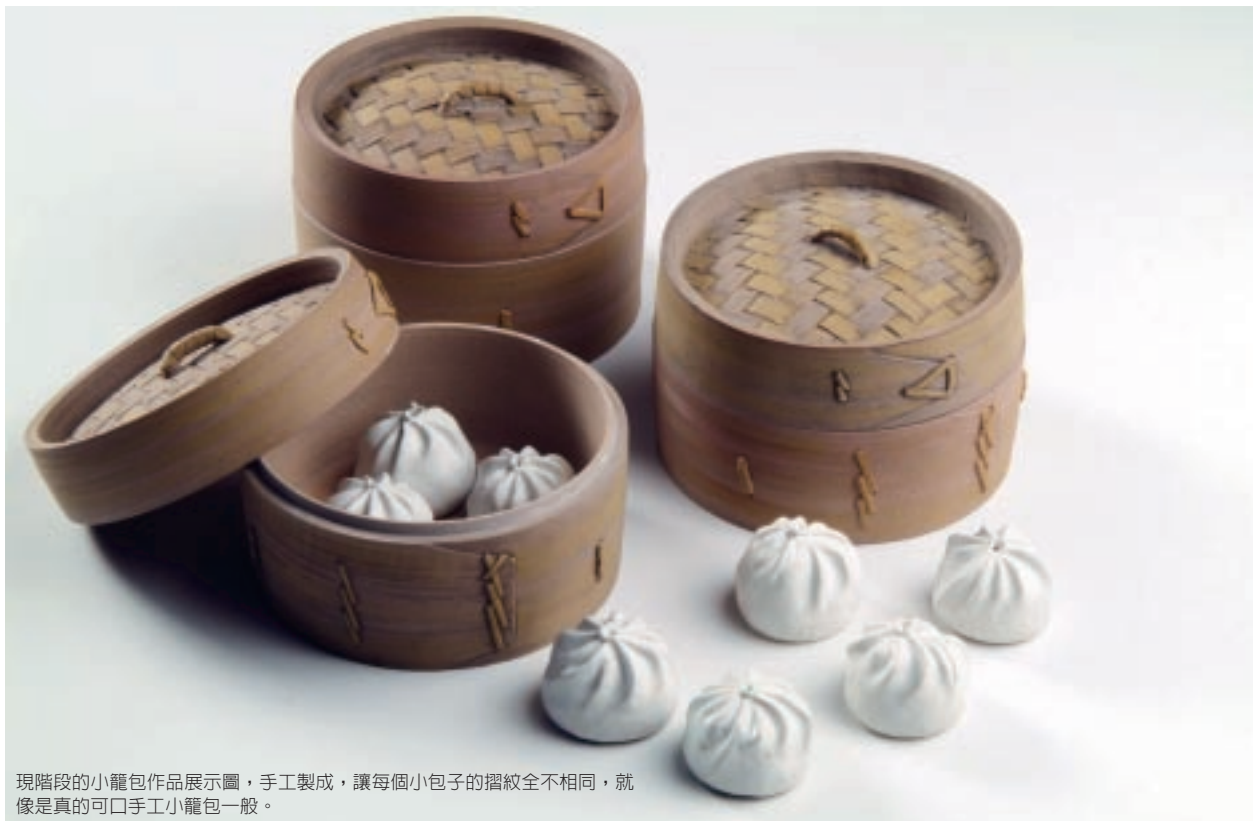
現階段的小籠包作品展示圖，手工製成，讓每個小包的摺紋全不相同，就像是真的可口手工小籠包一般。

既然周育潤擁有多樣國內外設計大獎的獲獎經歷，那麼或許他對於聚焦臺灣文化的主體性，小有看法，然