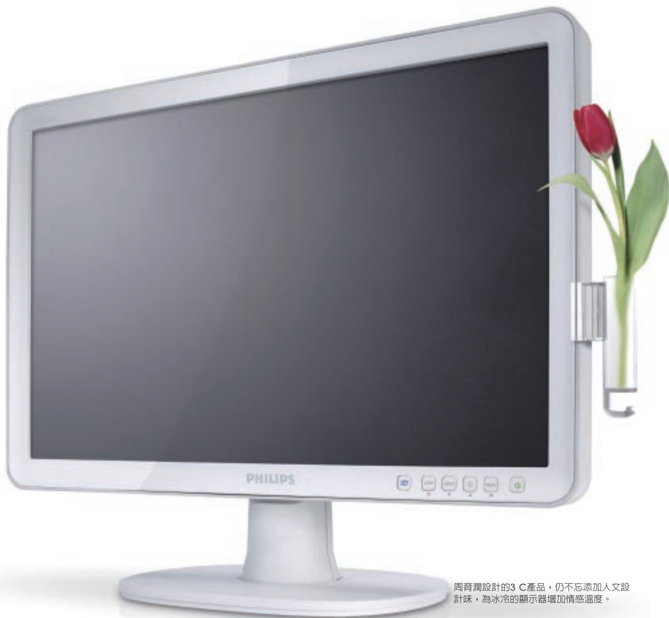
周育潤設計的3 C產品，仍不忘添加人文設計味，為冰冷的顯示器增加情感溫度。