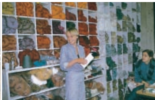
左起：芬蘭手工藝之友協會的外觀。在協會內研修的美國女性。手工藝之友協會工坊裡的紡線櫃

在赫爾辛基灣浮出的自然公園之島中，有間古老的宅邸，它即是芬蘭手工藝之友協會的所在地。