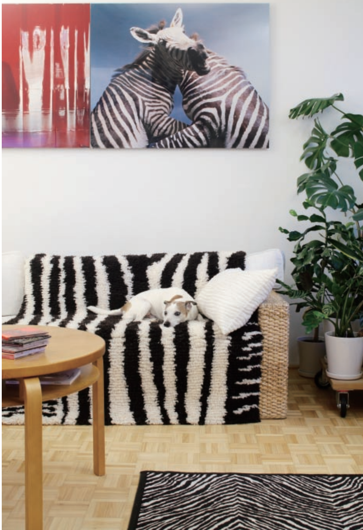
簡單而富設計感的織品，和北歐設計的俐落風格頗為相符。