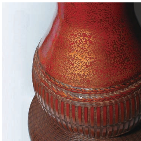
李榮烈 葫蘆 67×42×42cm 2009 桂竹、紗布、漆