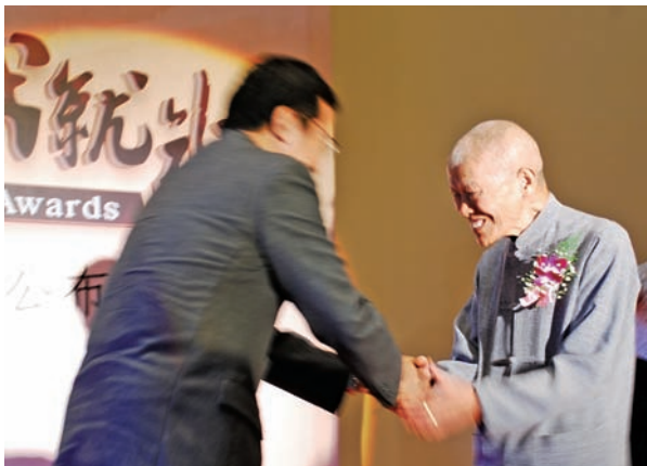
78歲的國寶級工藝家李榮烈，榮獲2013年工藝成就獎