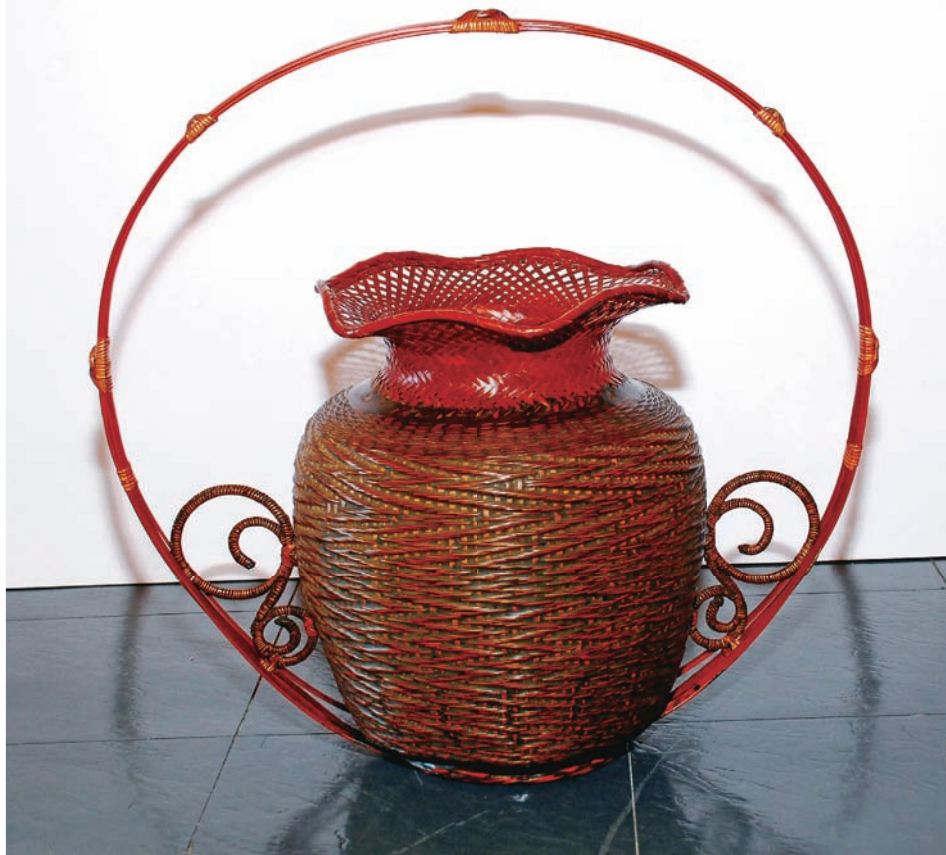
李榮烈 龍躍呈祥 60×60×38cm 2008 桂竹、藤、漆