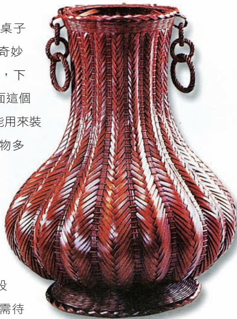
李榮烈 矢紋花器 36×36×47cm 1994 桂竹、生漆

林保堯教授評價李榮烈作品：「其間技法、設計、創意、實作等，不需待言；重要的是，竹編特色的桂竹結合漆藝的傳統風味，才是在現代居家生活空間的『亮點』表現與運用。特別是，竹編彰顯的竹材肌理，以及技法圖案的多樣構成，藉以漆藝的特性與竹編技藝，會融合一襯托出桌椅造形的豐碩、圓滿、完美，以及量體的厚實溫馨之感，令人有家的存在投射，誠是人居家生活的極品。」