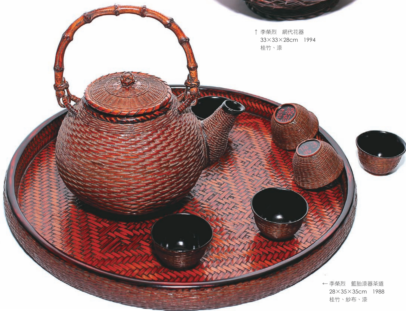
← 李榮烈 籃胎漆器茶道 28×35×35cm 1988 桂竹、紗布、漆