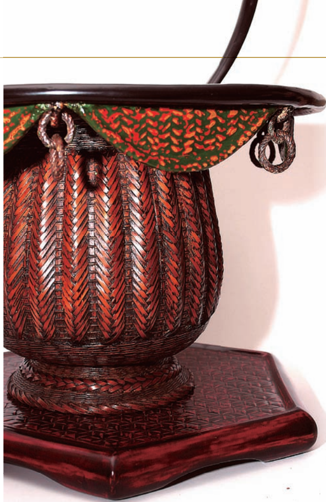
← 李榮烈 籃胎花器 65×33×33cm 1998 桂竹、漆