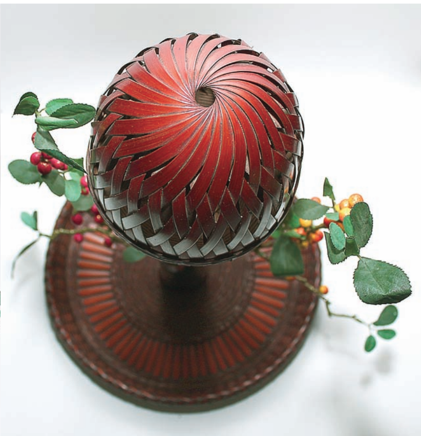
李榮烈 一支獨秀 70×38×38cm 1990 桂竹、漆