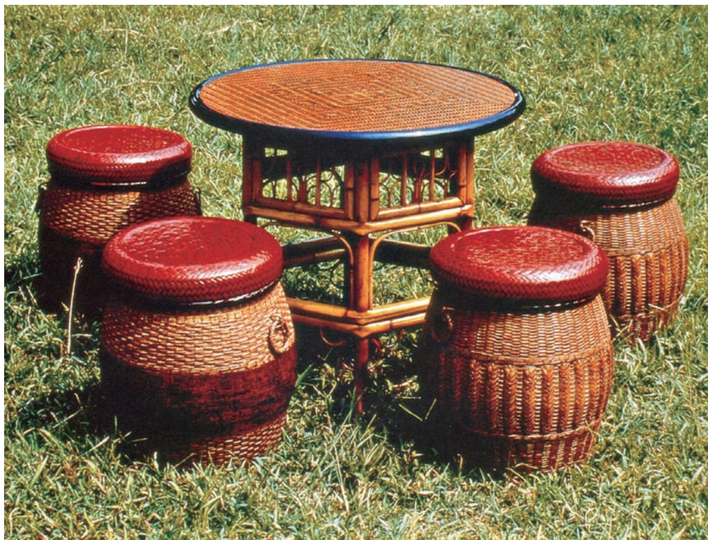
李榮烈 籃胎漆器桌椅組 桌子61×69×69cm、椅子42×35×35cm