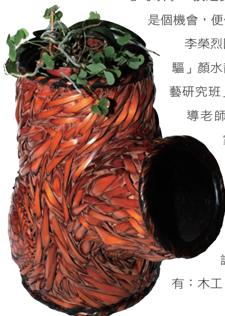
↓ 李榮烈 樹 48×36×51cm 1989 桂竹、麻竹、漆

1954年，李榮烈18歲那年，因病輟學在家休養，有天在報上看到南投縣「工藝研究班」招收學員訊息，修業期限是一年，學習期間的工具、材料概由公家負擔，他想可以學一技之長，又有學歷證書，應該是個機會，便偷偷去報名。