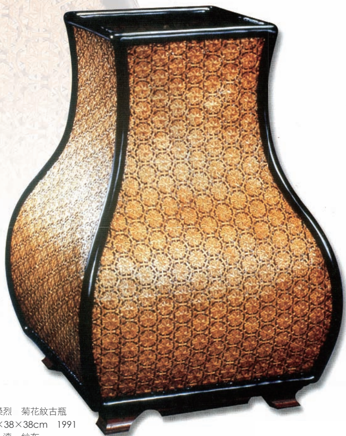
李榮烈 菊花紋古瓶 55×38×38cm 1991 竹、漆、紗布

歷經半世紀的試煉，李榮烈順應擁有竹編「好功夫」的使命，以竹藝回饋社會。不但擔任各項竹藝審查委員、裁判、講師，傳承傳統的竹編工藝。1992年起他更全心投入教學，各縣市文化中心、南投草屯國中、縣市農會、社教機構館舍、國立傳統藝術中心、文化部文化資產局等，有著孜孜不倦傳承竹工藝的身影，是為民間傳習技藝的大美音聲。2001年李榮烈從國立臺灣工藝研究