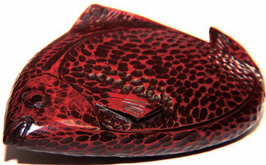
← 李榮烈 魚 4×13×23cm 1988 檜木、漆

李榮烈回憶1954年學竹藝時，王清霜老師從日本帶回一個籃胎漆器，紋路跟漆顏色搭配得很好。「那時我就放在心裡，想說什麼時候可以學到漆，就