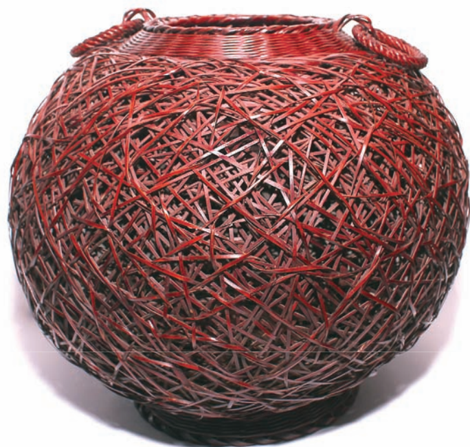
↑ 李榮烈 網代花器 33×33×28cm 1994 桂竹、漆