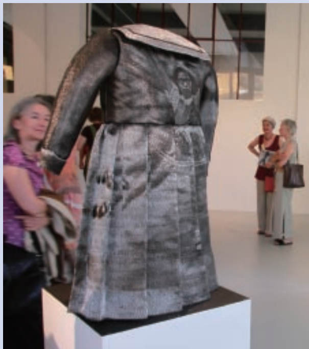
筆者參展作品〈制服〉，材質為不鏽鋼線及電子線，以手工提花織製後縫製而成。

Tradition to Textile Art / Design of Tomorrow）都關注傳統的傳承與當代的創作。由這幾次的主题可感受到，歐美對傳統織物文化保存給予重視的同時，也關注織物與數位科技結合或新材質的開發。