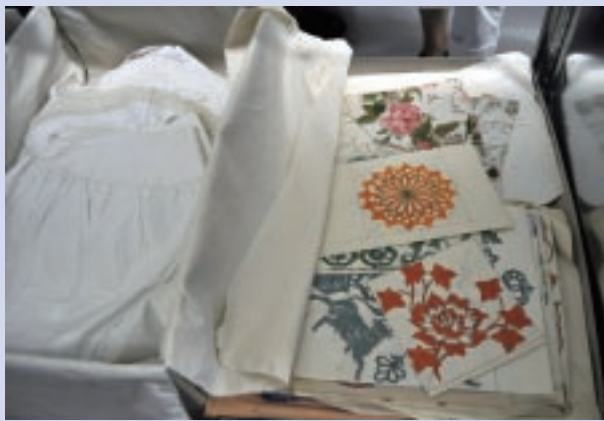
哈斯拉克織物中心的收藏品含實物及圖稿資料

年會的表現看來，織物中心有瞭解紡織專業的年輕工作團隊，也有能力執行專業的活動，但是一個中心仍須有文化產業行銷能力及募款能力的人員，還有軟硬體也須針對一般遊客的需要做修改。現在的規畫可以滿足專業藝術家或學生到此創作，如要吸引遊客來此參觀與消費，則在餐廳、旅館、賣場商品甚至廁所都要再加強。雖然有這些隱憂，但它位在歐洲中心的地理優勢，以及傳統產業留下的遺產並未被拋棄的文化優勢，讓人對織物中心的未來感到樂觀。反觀曾是臺灣紡織產業重要地方如：彰化、桃園與臺南，也曾輝煌過，也面臨產業外移與沒落，是否有理念與能力創造出這樣的織物中心？