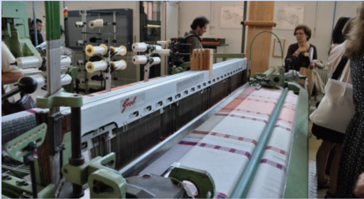
哈斯拉克織物中心的紡織設備