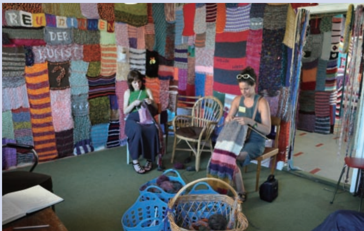
歐洲2009年文化之都系列展出中，一件互動的纖維裝置作品。

鄰近哈斯拉克的林茲藝術大學織物學系 (Kunst Universität Linz, Textile / Art & Design) 配合歐洲織物協