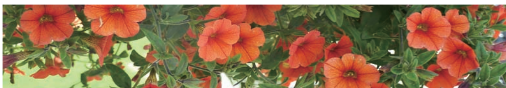
腰帶系列磁磚設計