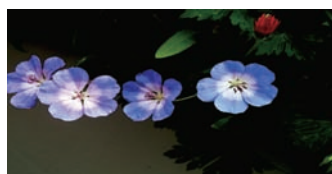
圖案系列磁磚設計

こし街づくり」活動，也就是我們臺灣現在推行的社區總體營造及文創活動，這裡舉的新瀉縣高柳町的例子是宮崎清教授帶領學生輔導的町村之一。