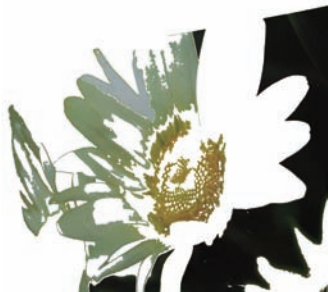
意象裝飾系列磁磚設計