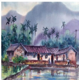
臺灣風景系列磁磚設計