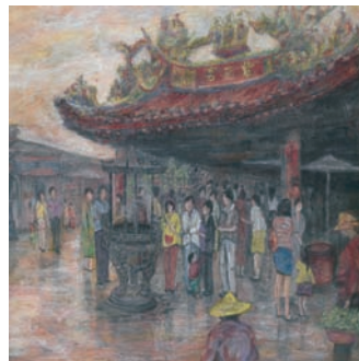
臺灣廟文化系列磁磚設計