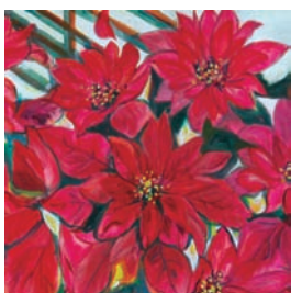
裝飾與抽象系列磁磚設計

當的重要性，可增加空間舒適感。此即完形心理圖形與背景原則之背景空間的單純性，喜歡簡單、輕鬆、清爽而言，這種意象的創作，希望能帶來喜悅的分享。