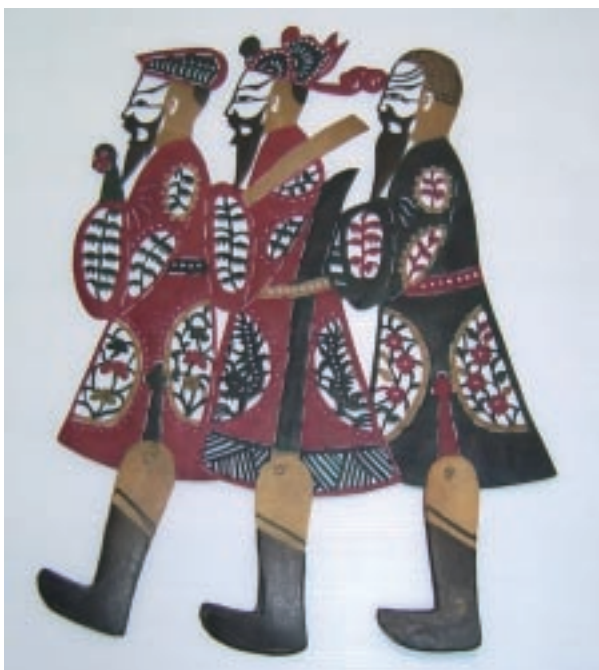
張福丁 福祿壽三仙