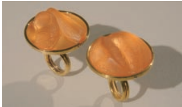
陳海琪 女士絕不會不戴戒指出門 24k鍍金、聚氨酯、銅 2005-07

陳海琪的戒指是以前其緊閉的嘴唇為模所鑄造的，暗示嘴巴是一個洞孔，這世界經由嘴巴隨著我們每一次呼吸進入體內。然而，嘴巴也是我們透過語言傳達自己身分認同的出口。在陳海琪的〈戒指〉（2006）和〈蝶吻〉（2007）作品中，我們原來感知為柔軟的一個身體