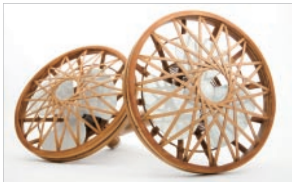
周育潤設計 / 陳高明製作 Breeze

稱的時尚造型，已經衝破某種局限，跨越到了國際，在歐美市場中受到收藏者的青睞，這樣的案例當然值得我們學習，但更重要的傳達是日人對事、對物的一貫「態度」，包含個人對作品的要求以及政府官方對於產業的文化政策等。作品有年輕一代的BAICA成員中臣一，其幾何不對稱的藝術造型使之成為美國市場中收藏愛好者的收藏對象之一；其它還有以裝置及燈光藝術見長的保坂紀夫作品、出自宮崎珠太郎之手簡約時尚的生活設計……。