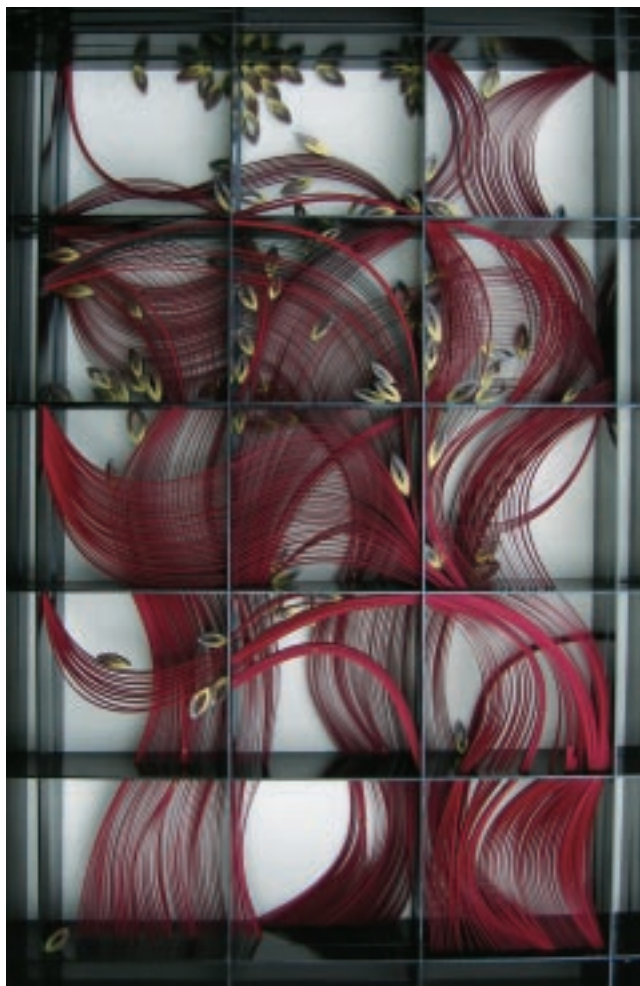
謝佳珍 中興新村·印象 竹、金屬、生漆 170×121.5×12cm 「意·動」區展品

「意·動」集結年輕創作者的作品，表達對生命意義的思考、對群體意識的批判、對天地自然的頌揚及對人文社會的觀察等。「動」是對整體創作能量特質的描述，工藝所為各種不同形式的展品尋找最佳伸展台，讓