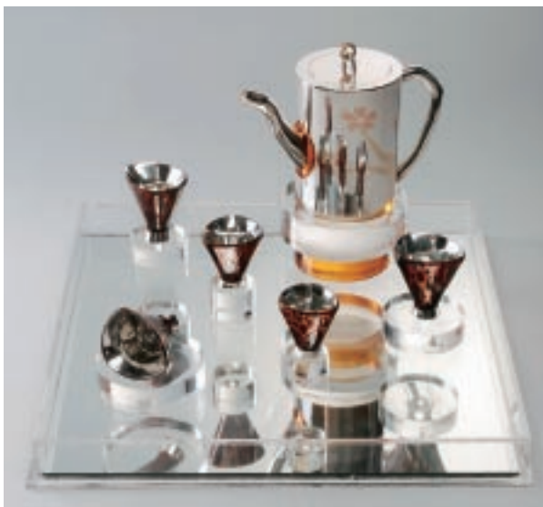
楊承峰 陽明櫻花A 950純銀、純黃金、18K金、玫瑰金、天然梨子地樹漆 「意·動」區展品