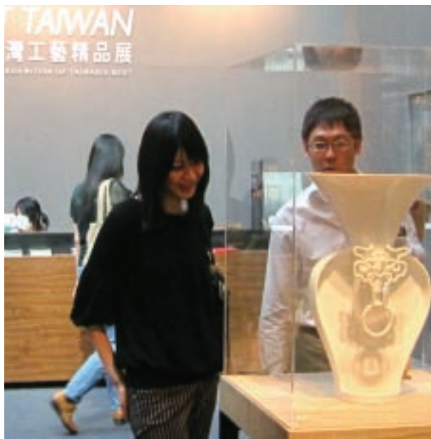
「Craft Taiwan 2009臺灣工藝精品展」展場一景

工藝所表示，「yii」的中文與「易」、「意」及「藝」字同音，代表著改變、異動，亦具有創意、工藝、及藝術之意涵。「yii」是由國內18位國家工藝獎得獎工藝家，以及15位具國際展出得獎經驗的新世代設計師，結合傳統技藝工法與現代流行元素的設計概