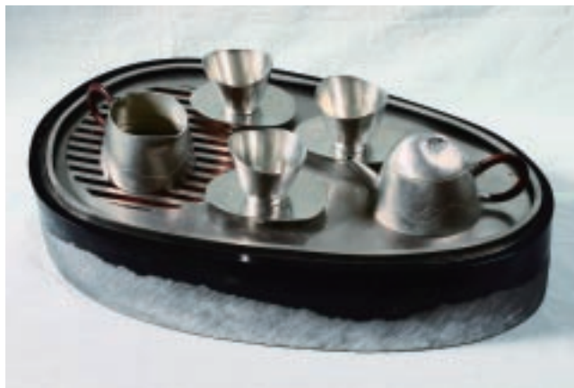
陳志揚 夜色山嵐 錫、天然漆 45×24×37cm 「意·動」區展品