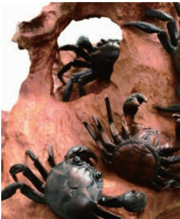
李松林 上蟬九垓（局部） 樟木 27×76×36cm 「器・雅」區展品

工藝與生活間展開另一種連結。胡慧琴的〈就這樣吧走在白朦朧裡〉以陶瓷呈現抽象意境的裝置；蘇小夢的金工超越婦女飾品的範圍，纖細表露對美好時代與生命的哀傷；陳志揚的錫藝創作則是結合多種金屬媒材，具有厚度與重量感的溫潤作品，結合器皿的實用性與藝術性。