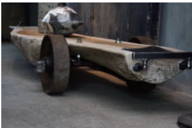
許偉斌 輪子長凳 木、鐵 294×45×24cm 「神・樸」區展品