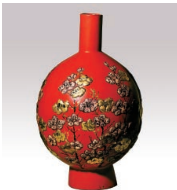
賴高山 梅花朱色瓶 天然漆、黃土粉 25×36cm 「器・雅」區展品