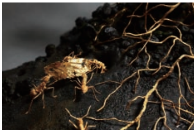
吳卿 瓜瓞綿綿 金、銀 115×56×121cm 「器・雅」區展品