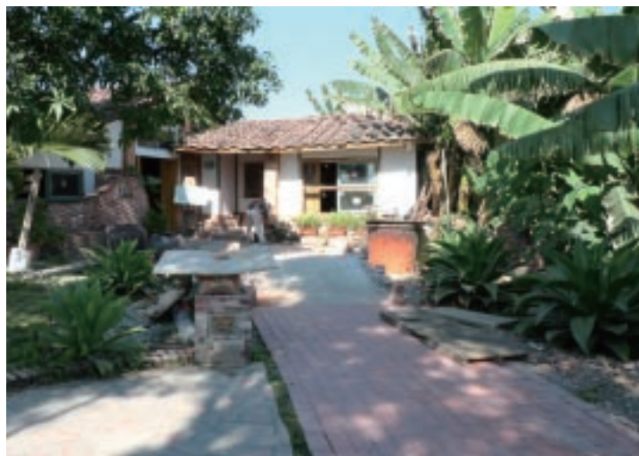
三和瓦窯以矮厝、紅磚塑造地區意象。