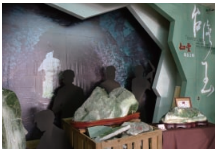
如豐琢玉中設計以玉石礦坑為主題的展示牆

(3) 培養潛在的工作夥伴：工藝工廠在觀光化的過程中，提供學習的機會來調整鄰里關係或吸收志工成為合作夥伴。受訪談的三個觀光型工廠皆透過解說員、