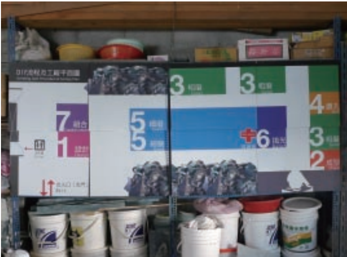
如豐琢玉在工廠中設置流程製作說明

工藝工廠觀光化轉型過程中所使用資源包括政府資源、與學校合作或接受其他單位輔導。進一步分析三個單位資源使用的方式如下：