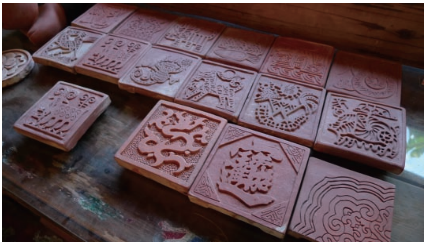
三和瓦窯設計的磚雕杯墊，以傳統圖騰吸引愛好文化的消費者。