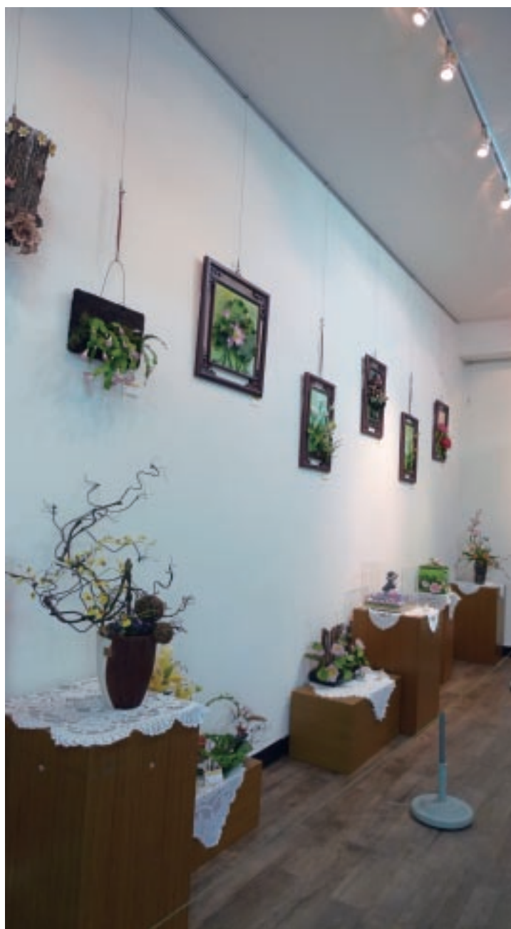
隆祥紙業經常邀請紙藝相關展覽在此展出

觀光工廠依其工藝技術、產業內容、轉型規模等不同也有許多差異，雖然如此，可被綜合提出其轉型策略包括：一、轉型時商品設計的策略：維持原有特色材料