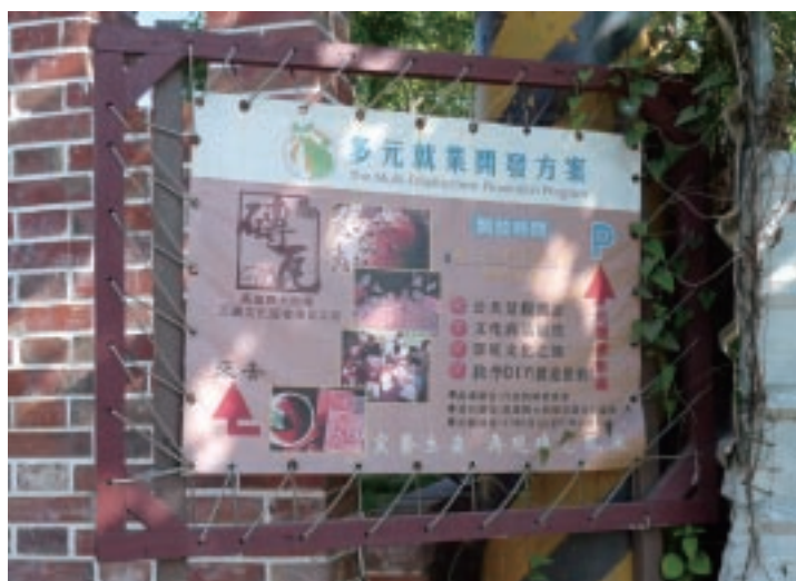
三和瓦窯結合勞委會多元就業方案，活化傳統工藝工廠。