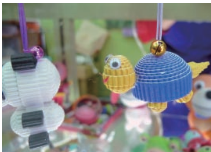
隆祥紙業應用瓦楞紙的中空特性，設計各種公仔造型。

(2) 針對消費目標族群的設計：以隆祥紙業為例，所設定消費族群為國小校外教學及親子旅遊散客為主，因此停車場可容納的數量以國小校外教學人數為考量，商品亦以學童喜愛的造型為主。而三和瓦窯以文化愛好者為對象，商品具較多文化圖騰等。因此，工藝工廠觀光化轉型必須重新設定新的消費族群進行空間與商品設計。