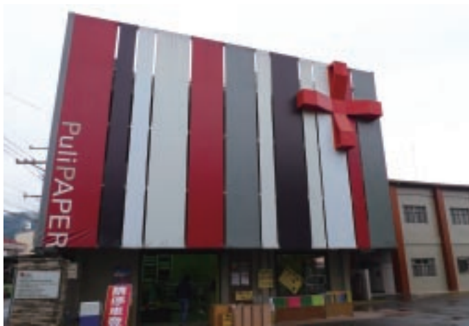
由紙廠轉型手創館的隆祥紙業

隆祥紙業原以生產特殊用紙為主，如包裝紙、2D紙、3D紙等，因應觀光轉型，陸續開發多款紙創意商品，如紙公仔、捲型日曆等，廠區內也提供導覽解說服務、DIY體驗，體驗商品包括造型時鐘、風車、筆盒、燈罩、公仔等，設定以教育、學習的商品進行開發。觀光工廠部分透過參展、學校校外教學、一般公司輔委會相關管道將服務商品銷售給學校、公司團體或一般散客（親子）。