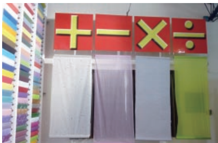
隆祥紙業的紙品展示

(1) 政府資源：工藝工廠觀光化轉型過程中所使用的政府資源以經濟部相關計畫為主，案例中如豐琢玉、隆祥紙業皆使用經濟部相關計畫，而三和瓦窯則多使用勞委會、文建會等計畫。