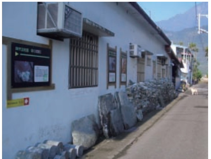
朝現代化觀光工廠邁進的如豐琢玉