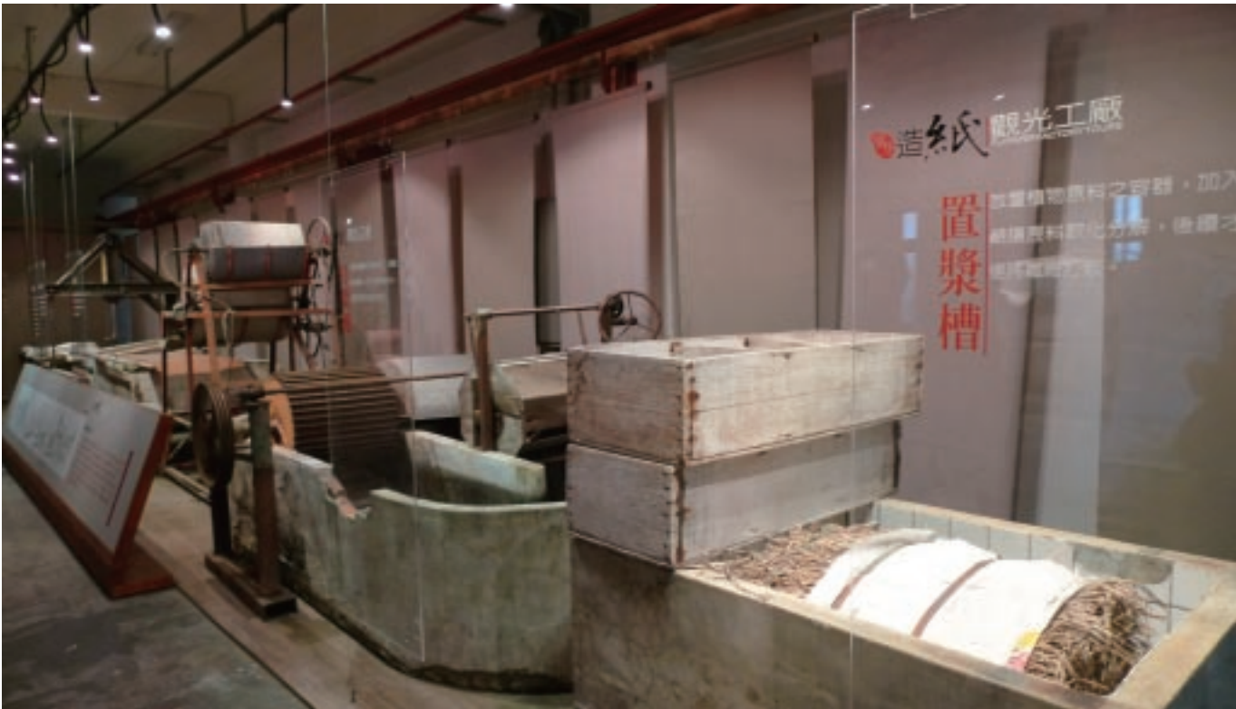
隆祥紙業的造紙觀光工廠