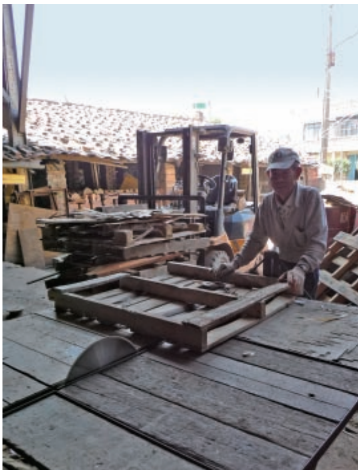
傳統工藝工廠擁有的文化資源是轉型的養分

近來，創意文化產業的觀念日漸被民眾接受，旅遊休閒的風氣也愈發蓬勃，使得原本以外銷為主的工藝工廠透過觀光化的轉型，而重新獲得國內消費者的青睞，找到產業重振的契機。工藝工廠轉型為觀光工廠，根據經濟部工業局所頒布「工廠兼營觀光服務作業要點」中，觀光工廠是「須領有工廠登記證，可提供參觀的部分廠地、廠房、機器設備等設施，供遊客觀光及休憩服務。」雖然如此，本文討論的案例以有工廠經營且目前正在進行觀光轉型之工藝產業為對象，包括：隆祥紙業、三和瓦窯及如豐琢玉。