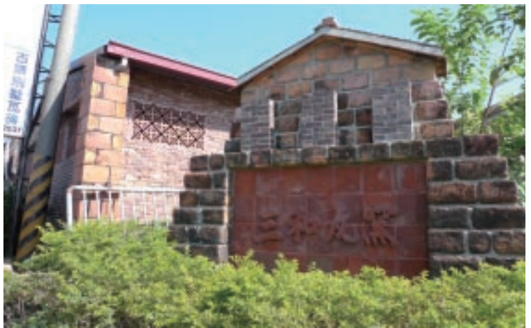
在學校鼓勵下開發文創商機的三和瓦窯

三和瓦窯結合地方觀光，推動文化商品與體驗，在全臺皆有配合的銷售地點，如宜蘭傳統藝術中心，新竹蘭園等。