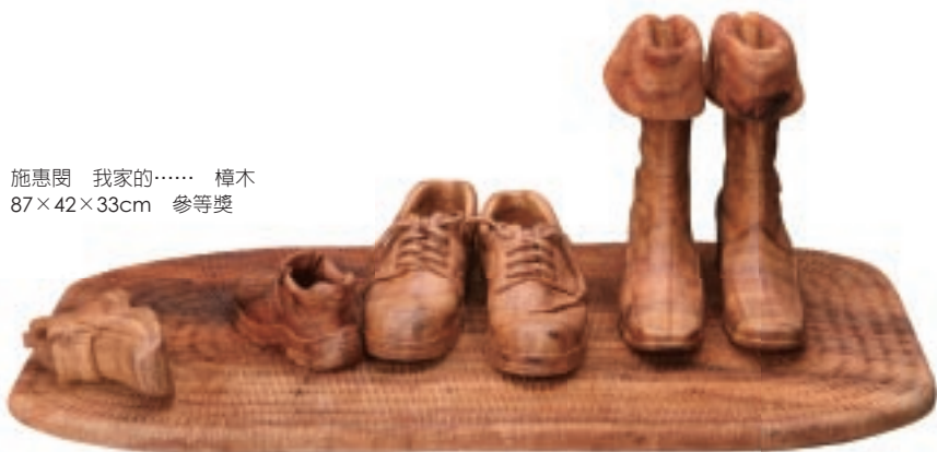
施惠閔 我家的…… 樟木 87×42×33cm 參等獎