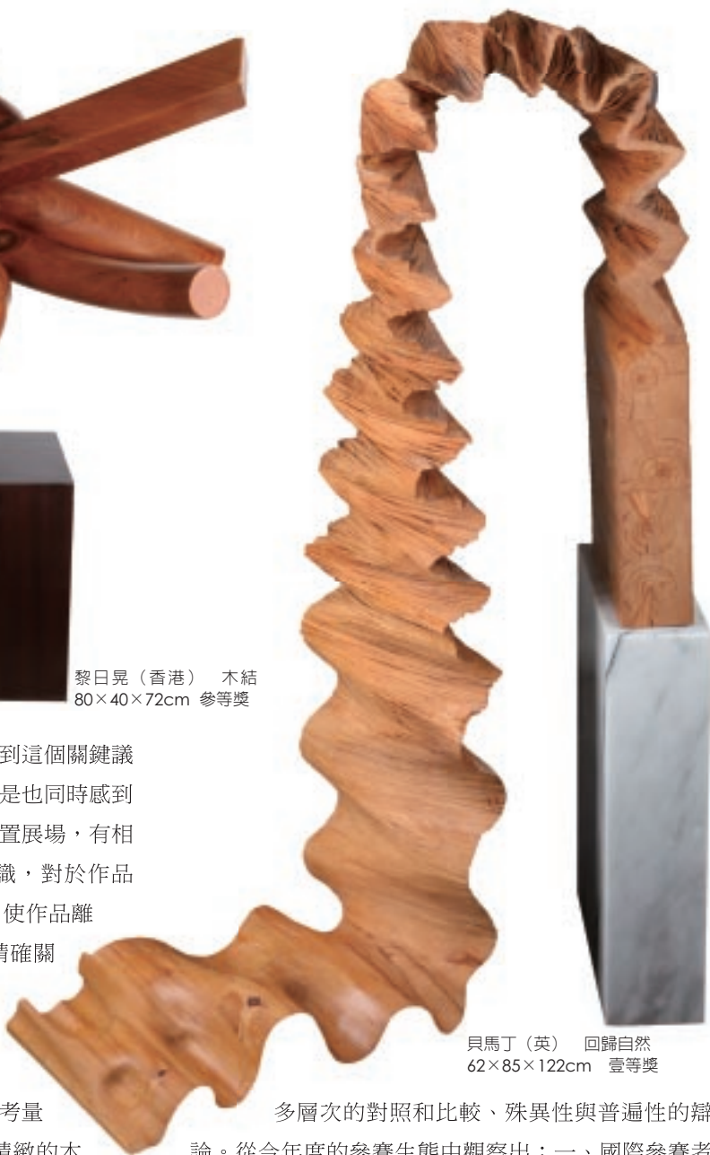
貝馬丁（英） 回歸自然 62×85×122cm 壹等獎

意捨棄。此次參賽者確實有數件作品碰觸到這個關鍵議題，首獎〈回歸自然〉作品尤為佳例。但是也同時感到遺憾的是，即便主辦單位要求作者親自布置展場，有相當數量的作品，對於基座的選擇缺乏意識，對於作品展現的適當高度和視線關係亦缺乏考量，使作品離開工作室後，失去了造型與環境之間的精確關係。當幾可亂真的〈麵包系列〉無法適當交代它的存在和真實世界之間的弔詭關係，則某種程度削弱了作品的藝術性。