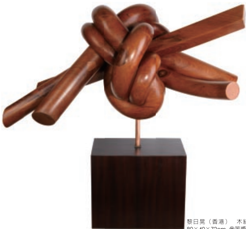
黎日晃（香港） 木結 80×40×72cm 參等獎