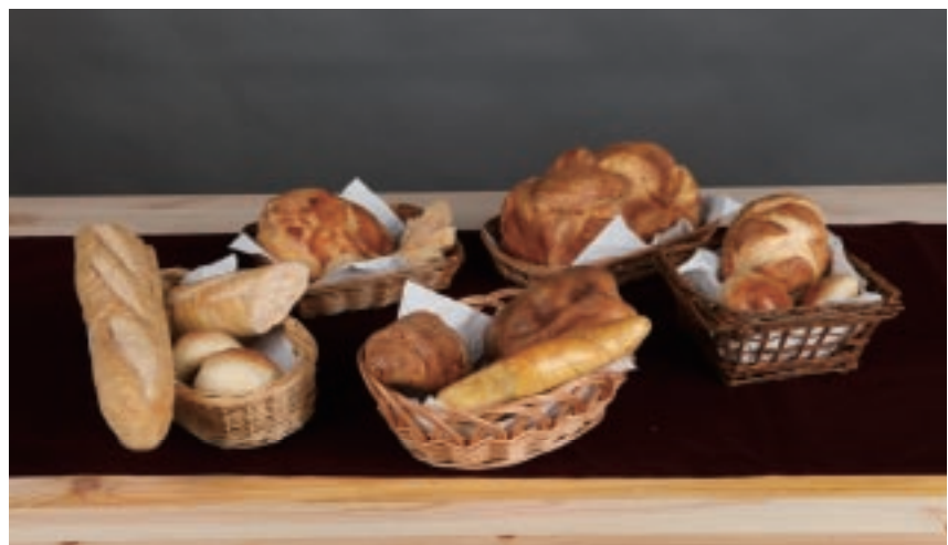
林士欽 麵包系列 木頭 120×60×90cm 佳作