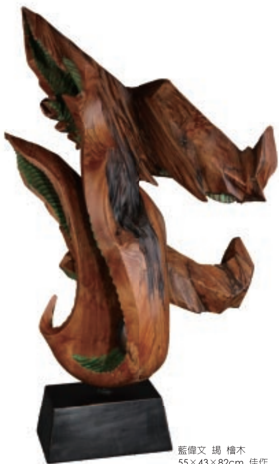
藍偉文 竭 檜木 55×43×82cm 佳作