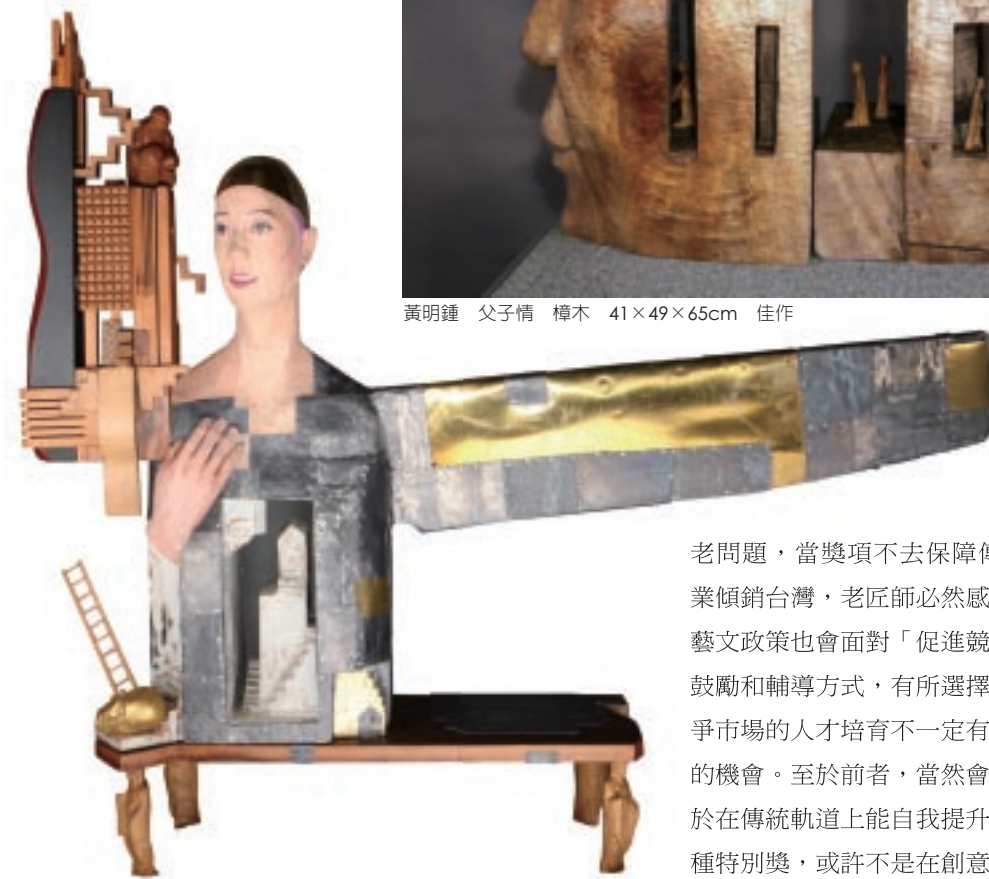
黃明鍾 父子情 樟木 41×49×65cm 佳作