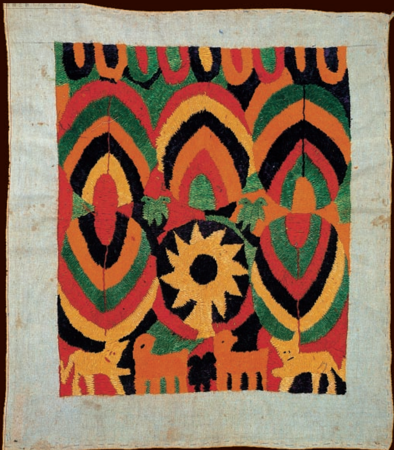
帕茲的掛飾物，多用作祭壇前裝飾。／下二圖 奇奇卡斯杜南克織物上用菱形刺繡裝飾的動物紋樣