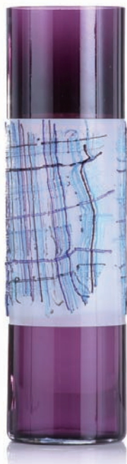
黃瓊儀 臺灣原住民編織服飾系列—達悟 吹製玻璃

雖然近年來臺灣經濟面臨到長久的不景氣，但回想到在這一塊土地上，擁有豐富多元的工藝文化累積，還有在民主自由、開放社會的環境之中，充滿著活潑與朝氣的創意，再加上臺灣擁有先進尖端的數位媒體與資訊科技。因此在這裡是一個發展文化創意產業的最佳基地，期待從文化創意產業出發，引領走出經濟不景氣的困境。🌱