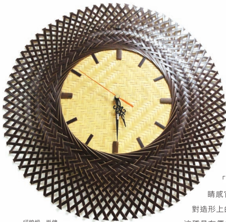
邱錦緞 掛鐘 竹編 南投縣竹山鎮