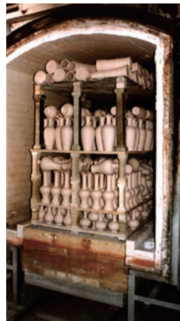
因應工業化的時代來臨，量產是促進產業提升必經之路，圖為鶯歌現代陶瓷燒窯

「傳統工藝」原本是反映在民間社會、生命禮俗或日常生活的器用藝術，是民間以自省的文化力量，所發展出來的生活應用與文明進步的軌跡，因此，站在現代的文化脈絡角度上，或許又可以將過去傳承下來的工藝表現型態，視為那個時候的民間時尚生活藝術。論及形成臺灣傳統工藝文化的淵源，除了原住民固有的部落文化、殖民時期的外來文化之外，漢人移民所帶進來的母文化本身，就是來自一個歷史悠久、文化深遠的系統，在過去漫長的