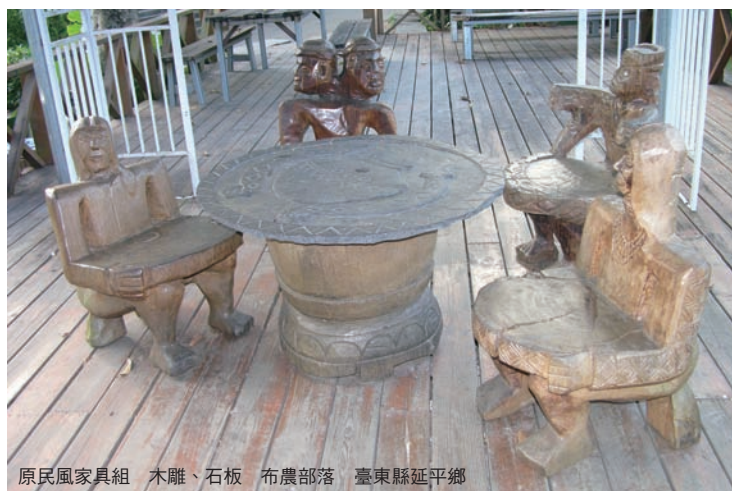
原民風家具組 木雕、石板 布農部落 臺東縣延平鄉

玻璃、木材、竹材或其他的纖維素材等，傑出的工藝師便巧妙地運用這些材質的特性，再加上創意設計之後，而製作出各式各樣的器物。同時為了增加或刻意凸顯材質的美感，創作者會在作品的表面再次加工，因而呈現質地粗糙的歲月痕跡、拋光打磨後的鏡射光澤、柔化處理過的軟硬彈性，為工藝作品的造型之外增加了視覺之