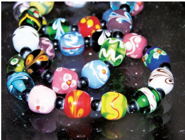
排灣族琉璃珠 蜻蜓雅築 屏東縣三地門鄉