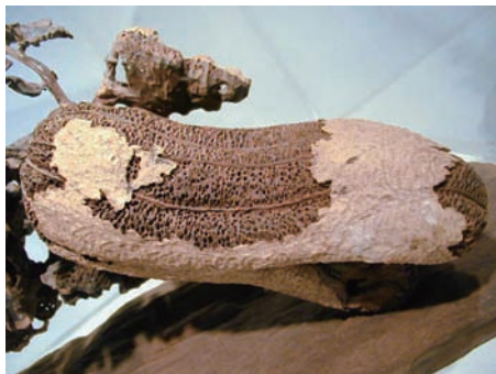
奇木雕刻 苗栗縣立三義木雕博物館

隨著大時代的環境變遷，工藝文化事業的發展，也是要適應不同年代、型態的社會趨勢，同時又要兼顧工藝本身的提升與精粹，在追求藝術性美感和實用性機能之餘，更要顧慮到生產成本、製