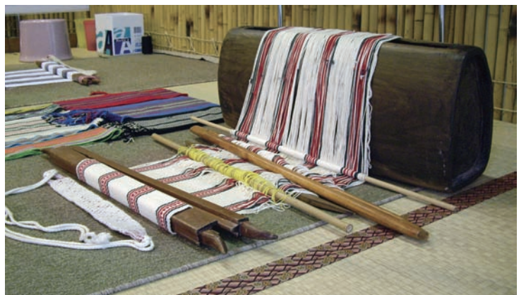
泰雅族編織 新北市立烏來泰雅民族博物館

大多是以集體或群聚的方式來默默從事工作，其最大的意義乃是為地方上形成一個文化面積，甚至為這個地區造就出最大的文化特色。每個地區的文化形成，除了固有風俗民情的發展背景之外，最能夠凸顯地方鄉土特色之處，就是當地悠久歷史傳承下來的典型美術工藝活動，日久便形成所謂的「文化產業」。文化產業不但是這個地區藝術文化的結晶，有時候是當地長久下來主要賴以生存的經濟原動力，甚至有可能是這個地區未來能夠凝聚發展的新契機，換言之這種經濟性的利益因素，可以加促這個地區美術工藝活動，朝向「文化產業化」、「產業文化化」的型態發展。