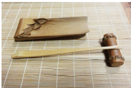
葉基祥 茶則 竹器 南投縣竹山鎮