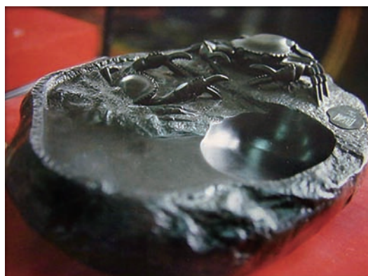
董坐 謝謝（硯雕） 螺溪石 彰化縣二水鎮