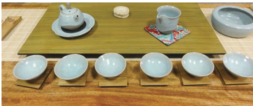
茶具組合簡單的造型、精緻的材質，構成了茶藝生活的美學品味