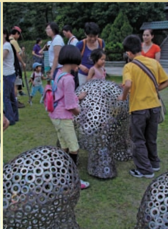
8 2009年重新開幕的煉金樓