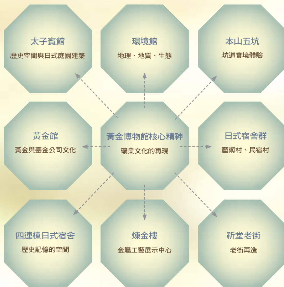
黃金博物館的經營策略示意圖

黃金博物園區位於臺北縣瑞芳鎮金瓜石，過去百年以來曾是盛極一時的金礦山城，聚集上萬人口在此淘金圓夢，如今金礦已盡，礦業凋零許久，臺北縣政府於2004年重新整修開幕，是台灣首座以生態博物館為概念所打造而成，園區結合了社區力量，將金瓜石地區珍貴的自然生態、礦業歷史遺址、聚落建築及人文資產做一完整的保存與呈現，並肩負起地方觀光發展的責任，藉著各種藝文推廣活動以及生態旅遊的推行，來活絡地方文化的動力，凝聚共識。而金屬工藝則是因為過去礦業歷史的背景，以及環境因素，由園區選擇主導推動的工藝，鼓勵民間主動參與，將金工藝術深植於社區之中，目前園區的金屬工藝則以煉金樓為一個發展基地，在各展示宿舍展示主題及經營策略中，繼續穩定發展，並將融入未來地方老街再造、日式舊建物空間再利用等新的文化政策中，示意圖見右圖。