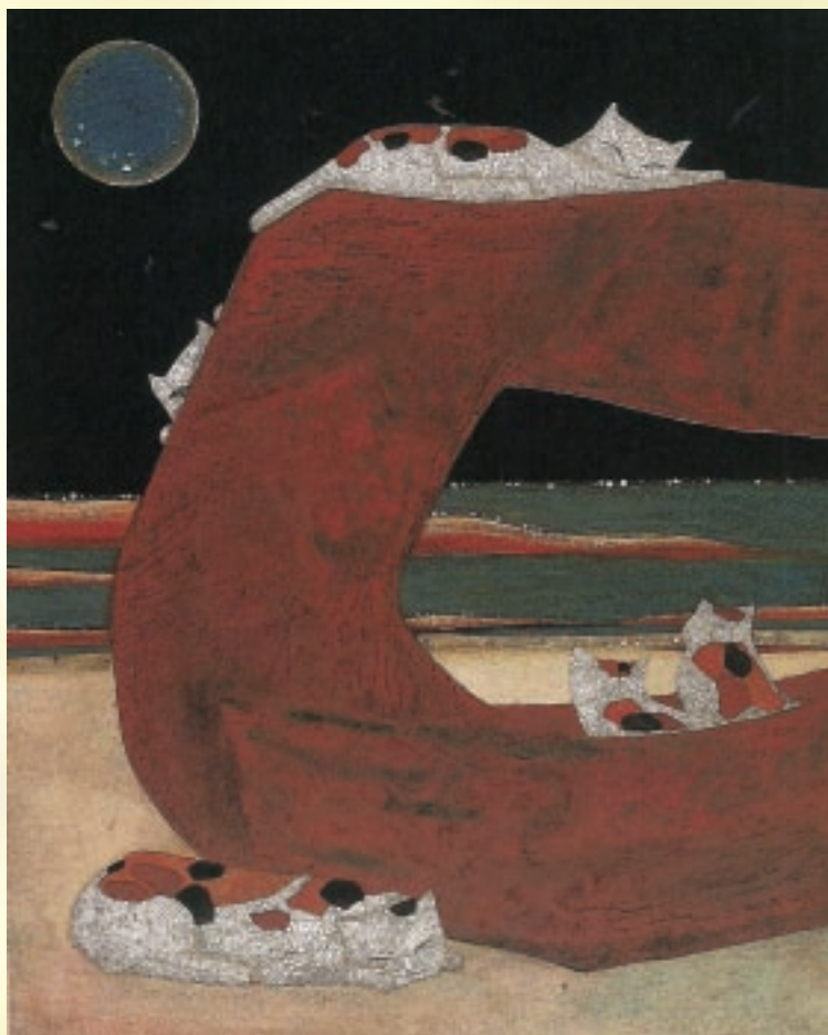
上圖 顧琪君 海邊的家 漆畫

從事藝術創作者，一定要具備下列的基本修為，方能擁有自己的一片天：1. 有毅力恆心（不達目的絕不終止）；2. 不