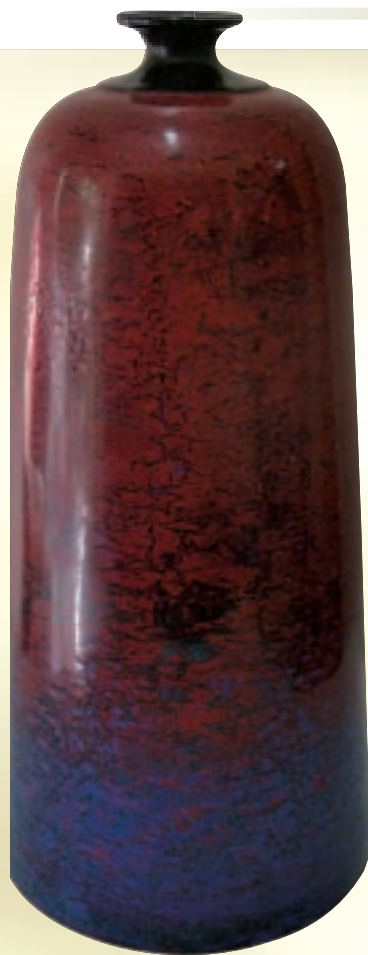
上圖 康錦樹 紅森林 漆陶

人類藉著某種手段，把自己的思考、理念表現於外並傳達給別人的能力，是人類所獨具的天賦，例如將喜、怒、哀、樂的感受，藉著音樂把它表現出來，便是其手段的一種。這表現行為孕育了各種藝術的表現形式：電影、建築、美術等就是其中的產物；甚至在各領域裡又細分出各種專門範疇，創造出各種獨立、獨特的表現形式，工藝就是其中之一。工藝的定義因時代的進步而有不同的說法，我國傳統上對工藝的解釋，一般都界定在技藝與才能的領域裡，我國在古代典籍中對工藝的定義有如下的記載：東漢許慎《說文解字》云：「工，巧也，善其事也。凡執藝成器以利用，皆謂之工。」又言：「工，巧飾也。」今日對工藝則以精巧的技能、製造精美的器物來註解。美國人邦塞則認為：「工藝是一種改變材料的形式以增加人類使用上之價值的職業……。」所以貼切來