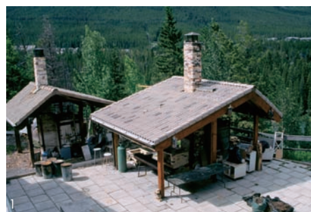
1 班福中心陶瓷工作室的戶外柴燒窯爐

碩大的工作室裡搭配整片的落地窗，窗外的美洲鹿一點也不羞澀，而健全的硬體設備讓陶瓷工作室的窯爐遠遠比使用的藝術家來得多，對藝術家無微不至的照顧讓