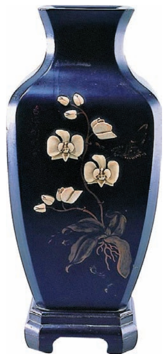
右圖 漆器類一般古物——黑漆鑲嵌彩繪蝴蝶蘭紋方瓶