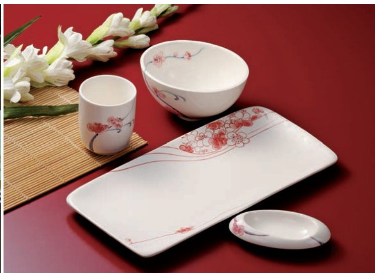
右圖 梅仔花築巢套餐組