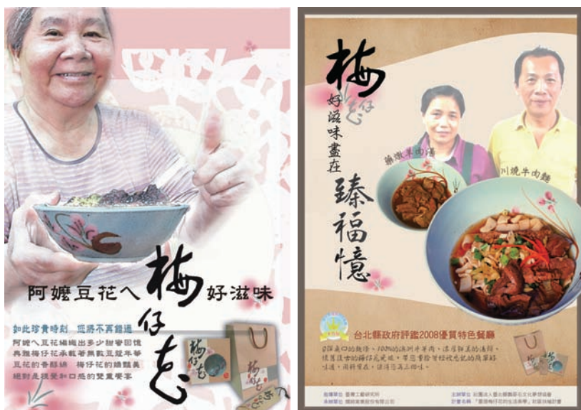
上左圖 結合豆花餐飲的「梅仔花」餐具推廣