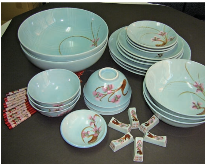
左圖 梅仔花原味餐具組